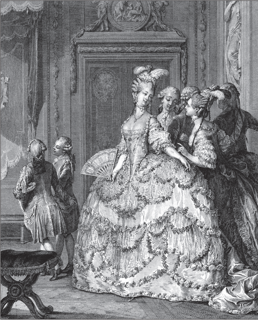
5. Jean-Michel Moreau le Jeune, La Dame du palais de la Reine , 1776, gravure : 50 x 37 cm, dans Seconde suite d'estampes pour servir à l'histoire des mœurs et du costume des François dans le dix-huitième siècle , Paris, Prault, 1775-1777, planche 24.

Versailles, bibliothèque municipale de Versailles.