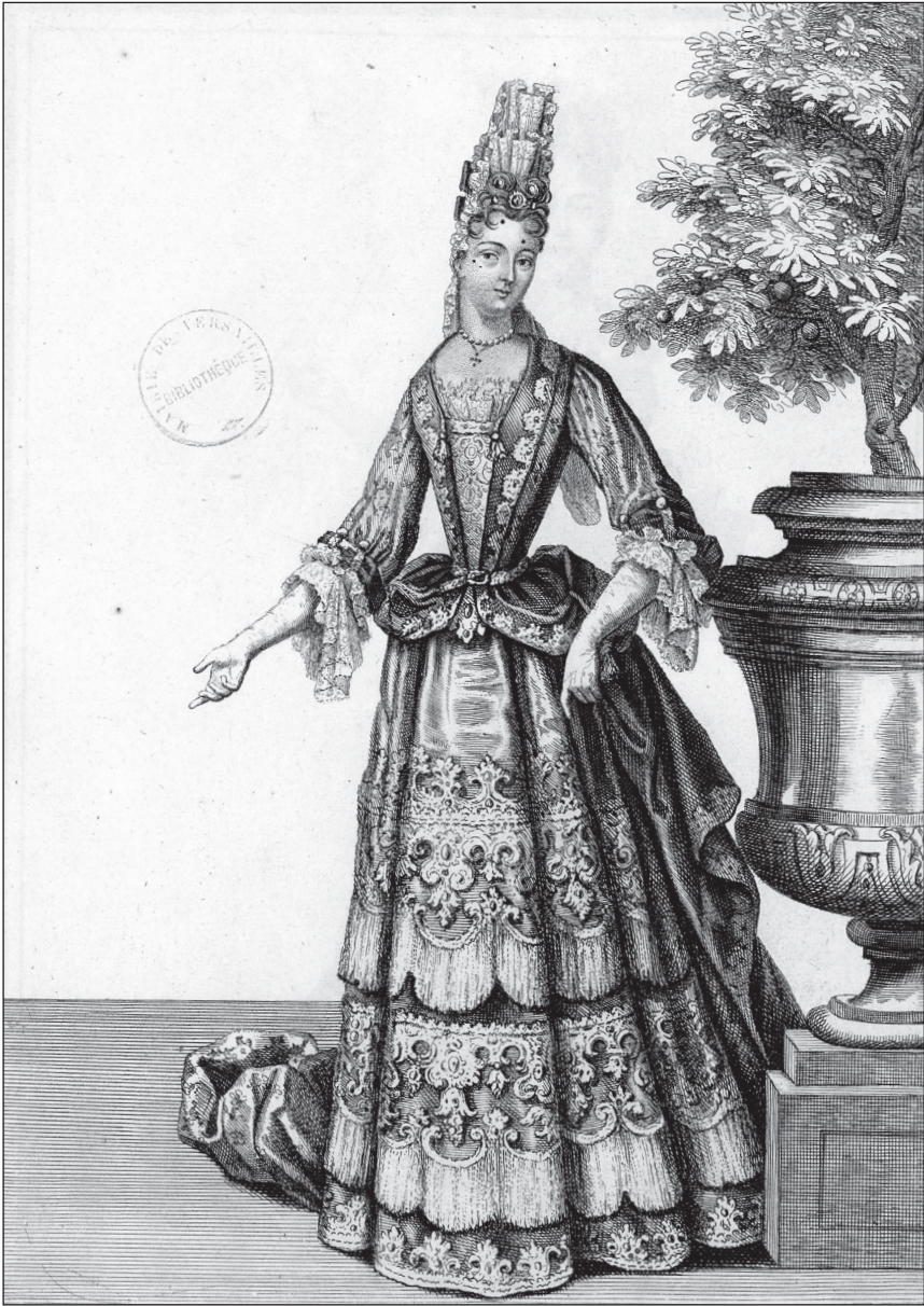
4. Henri Bonnard, Dame de qualité à la mode , 1694, gravure : 37,5 x 24,5 cm, dans Figures du règne de Louis XIV vol 1, fol 120, Paris, Bonnard.

Versailles, bibliothèque municipale de Versailles, Rés fol A 29 m_fol 120.