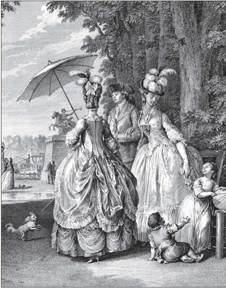
6. Jean-Michel Moreau le Jeune, Le rendez-vous pour Marly , 1776, gravure : 50 x 37 cm, dans Seconde suite d'estampes pour servir à l'histoire des mœurs et du costume des François dans le dix-huitième siècle , Paris, Prault, 1775-1777, planche 21.

Versailles, bibliothèque municipale de Versailles.