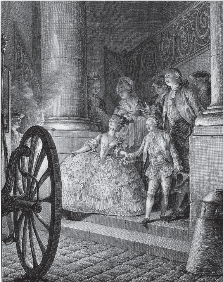
2. Jean-Michel Moreau le Jeune, Les petits parains , 1776, gravure : 50 x 37 cm, dans Seconde suite d'estampes pour servir à l'histoire des mœurs et du costume des François dans le dix-huitième siècle , Paris, Prault, 1775-1777, planche 18.

qui présentent des corps pour fillettes (fig. 4 dans ill. 1) et pour garçons (fig. 5 et 6 dans ill. 1). Les portraits de cour et les gravures présentent les enfants en habit de cérémonie qui n'est pas un vêtement spécifiquement adapté à leur âge mais un modèle réduit de la tenue des adultes. Une gravure intitulée Les Petits Parains (ill. 2) montre bien l'adoption du costume de cour par les enfants pour lesquels se vêtir constitue un apprentissage indispensable qui fait partie d'une pédagogie du maintien et d'une intériorisation de normes comportementales.