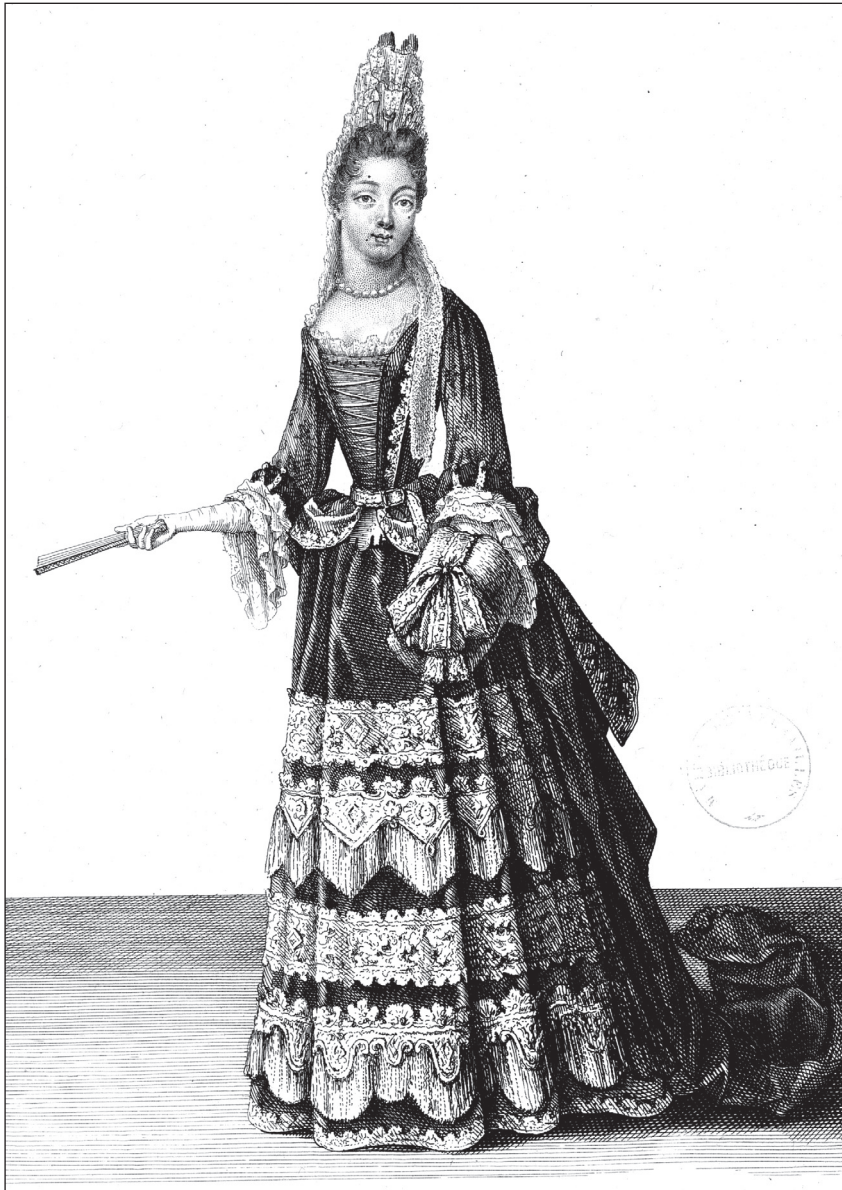
3. Henri Bonnard, Madame la duchesse du Maine , 1694, gravure : 36,9 x 25,2 cm, dans Figures du règne de Louis XIV , vol. 4, fol 31, Paris, Bonnard. Versailles, bibliothèque municipale de Versailles, Rés fol A 32 m_fol 31.