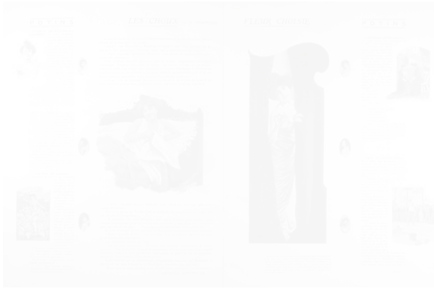
Fig. 27. Anonyme, maquette foisonnant de similigravures, La Vie de Paris s.n. [un des dix premiers], s.d. [mi-1901], page double, n.p.

Lorsque les images sont la donne , le texte est une légende et l'histoire semble avoir pour seule raison d'exister les images qu'elle suscite. Ce sera encore plus clairement le cas avec Les Danses voluptueuses , ou La Femme et l'amour 31 , publications en fascicules, à mi-chemin entre le périodique et le livre. Leur format plus grand (in-8°) permet au maquettiste des effets plus nombreux que dans les romans parus chez Nilsson et Offenstadt. Le souci plus élevé de la mise en page se vérifie dans des encadrements plus élaborés et l'emploi de la page double, et non simple, comme base de la maquette.