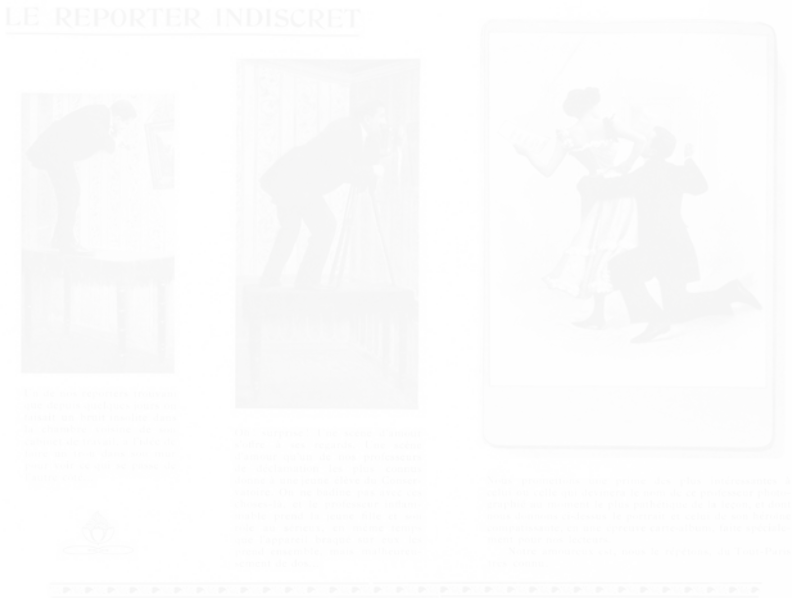
Fig. 29. Anonyme, Le Reporter indiscret , similigravure, La Vie de Paris s.n. [un des dix premiers], s.d. [mi-1901], n.p.

de pénétrer chez la belle [Zoé Ratichon, l'étoile des Folies Boudebois] ». L'interview se mue en scène de séduction. Neuf illustrations les montrent ensemble ; ce n'est donc pas le reporter qui a pris les photos, mais ce que j'appelle, en ce genre de circonstance, le photographe omniscient , ou si vous préférez, le photographe omnivoyant . Il voit sans être vu, c'est le voyeur parfait.