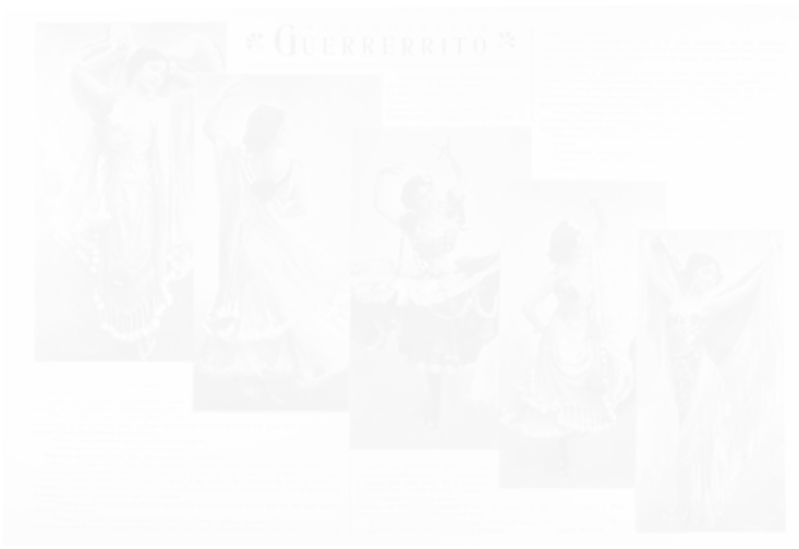
Fig. 26. Anonyme, cinq similligravures en diagonale, La Vie de Paris s.n. [un des dix premiers], s.d. [mi-1901], page double, n.p.