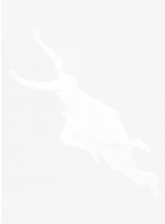
Fig. 34. Anonyme, Étoile filante , similigravure, La Vie de Paris s.n. [un des dix premiers], s.d. [mi-1901], n.p.

J'accepte qu'une femme flotte dans les airs pour symboliser une étoile filante, mais la photographie vient tout briser. Comment nommer ce genre, composé de collages et de photos truquées, légendées par des fictions ? On y trouve des éléments comiques et grivois, mais l'adjectif qui me vient le plus souvent à l'esprit est celui de « littéral ». Est-il possible de parler d'une photographie « au pied de la lettre » tout en gardant l'idée que la photographie domine l'écrit dans cette publication, et qu'elle est le « clou » d'une légende ? Pour répondre à cela, il faut regarder comment les textes ont été conçus pour rendre les images « littéraires » et « littérales ».