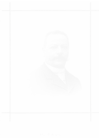
Fig. 22. Anonyme, Henri Paul, Préfet d'Alger , phototypie, La Chronique africaine illustrée (Alger), 1 er semestre 1892, hors-texte en regard de la p. 60