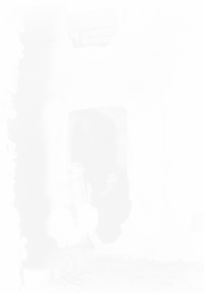
Fig. 23. Anonyme, phototypie pour Lys du Pac, « En rhamadan », L'Algérie artistique et pittoresque (Alger), 7 e fasc., s.d. [1 er sept. 1890 ?], p. X

Une des images de prostituées dans l'article « En rhamadan » 24 (fig. 23) est la même que dans Les Trois Dames de la Kasbah 25 (fig. 24), sauf que celle qui accompagne la nouvelle de Loti a été recadrée pour cacher une obstruction surexposée au premier plan. L'on voit alors que la photo fut prise au flash (c'est-à-dire à la lumière du magnésium, grâce au « conflagrateur », dont il est parfois question dans la revue). Le flash trahit la présence du photographe, or celui-ci n'a pas de place dans le texte littéraire. Grâce au recadrage, on pense voir dans la nouvelle de Loti les femmes illuminées par les derniers rayons du soleil couchant.