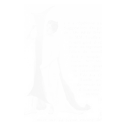
Fig. 28. Anonyme, lettrine « l », similligravure, La Vie de Paris , n° 15, s.d. [mi-1901], n.p.

la forme d'un trou de serrure, ou encore celle des lettrines (fig. 28). Toutes sortes d'arrangements géométriques et dynamiques sont possibles grâce au talent du maquettiste. Loin des sages bandeaux, des culs-de-lampe centrés et des vignettes imprimées comme de la ponctuation décorative, loin des illustrations redondantes et à la limite supprimables sans perte de sens pour le texte, les images de La Vie de Paris sont la raison d'être de l'hebdomadaire, elles fondent son projet éditorial et elles organisent chaque page et chaque histoire.