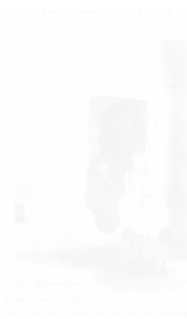
Fig. 24. Anonyme, phototypie pour Pierre Loti, Les Trois Dames de la Kasbah , Paris, Calmann Lévy, 1896, p. 71