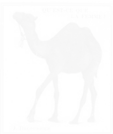
Fig. 30. J. Decourrier, Qu'est-ce que la femme ? , similigravure, La Vie de Paris , s.n. [un des dix premiers], s.d. [mi-1901], n.p.

Le photoreporter, tel que La Vie de Paris le met en scène, est un voyeur, un séducteur, un farceur. Il est misogyne (fig. 30) et conservateur, s'intéresse au monde, mais seulement par le biais des potins, à l'art du spectacle (théâtre, variétés), mais seulement par le biais de la femme.