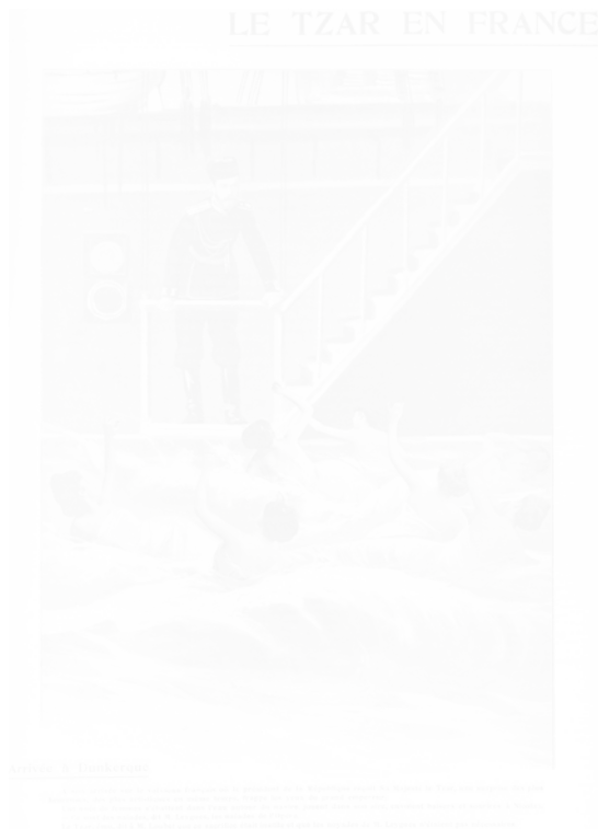
Fig. 31. Anonyme, Le Tzar en France , similitravure La Vie de Paris , n° 20, s.d. [mi-1901], n.p.