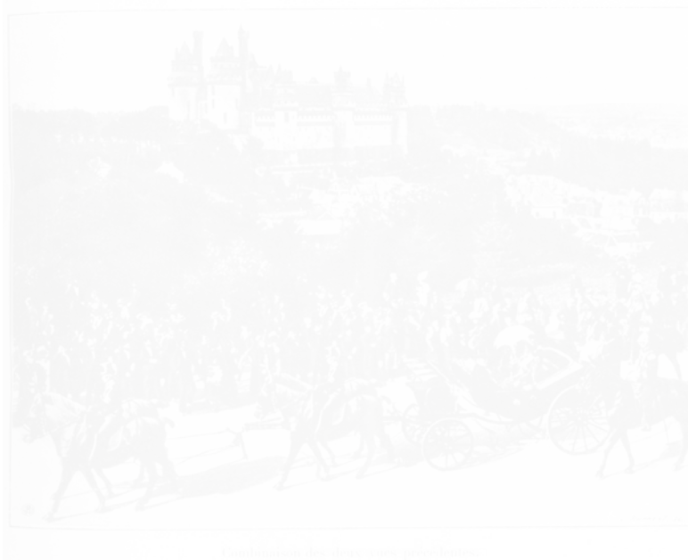
Combinaison des deux vues précédentes

Fig. 32. Anonyme, Le Tzar et Félix Faure au Bois de Boulogne , similigravure illustrant C. Chaplot, « L'illustration avant la lettre » Photo-Magazine (Paris), n° 6, mi-février 1904, p. 46