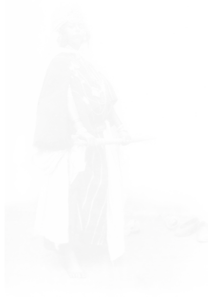
Fig. 25. Anonyme, Farfaria , phototypie pour Paul Margueritte, « Farfaria », L'Algérie artistique et pittoresque (Alger), 1 re année, 1 er fasc., s.d. [1889/1890], p. 3

Un lecteur de Loti pourrait s'offenser de trouver, pour illustrer un passage où des prostituées sont vues par les marins de l'histoire, une photo montrant de vraies Algériennes qui s'y trouvent ainsi calomniées. C'est seulement en lisant la revue de Courtellemont qu'on apprend qu'il s'agissait en fait de prostituées. Pareillement, une photo de Farfaria (fig. 25) accompagne l'histoire de cette prostituée « pour qui une vingtaine d'hommes, Marocains et spahis, se sont égorgés en une seule nuit » 27 , sans que le lecteur puisse savoir si la photo représente une vraie prostituée ou un modèle. Le texte de Margueritte est qualifié de « nouvelle » et serait une rencontre imaginée – or l'existence réelle de Farfaria est attestée lors d'un long article sur Biskra rédigé par Émile