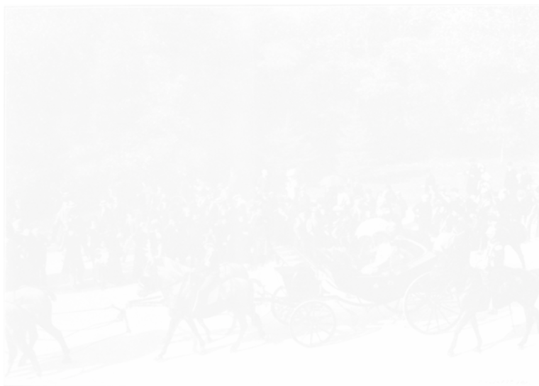
Le Tzar et Félix Faure au Bois de Boulogne

Fig. 32. Anonyme, Le Tzar et Félix Faure au Bois de Boulogne , similigravure illustrant C. Chaplot, « L'illustration avant la lettre » Photo-Magazine (Paris), n° 6, mi-février 1904, p. 46