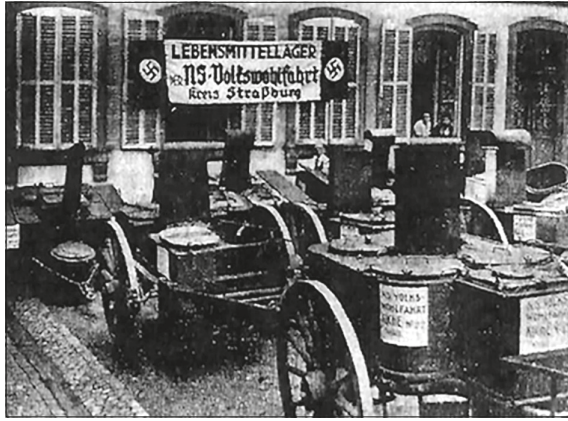
Fig. 3. Photographie illustrant l'aide de la NSV aux évacués de Strasbourg ( Straßburger Neueste Nachrichten , « Küchenbatterie der NSV. in Bereitschaft », 10 août 1940)