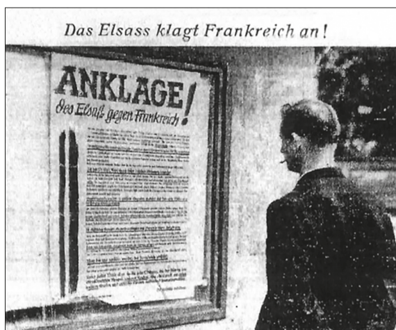
Fig. 2. Propagande anti-française en Alsace par le biais d'affiches ( Straßburger Neueste Nachrichten , « Das Elsass klagt an! », 29 juillet 1940)

Après l'armistice de juin 1940, le sujet des évacuations est fortement repris dans la presse alsacienne et mosellane, alors sous autorité allemande, à la suite de l'annexion de fait de l'Alsace-Lorraine 26 . Les journaux régionaux et les affiches de propagande instrumentalisent alors les évacuations comme symbole de l'exploitation des Alsaciens et Lorrains par la France ( fig. 2 ) afin de servir leur campagne anti-française.