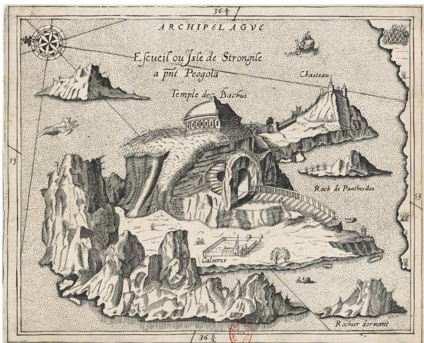
2. « Escueil ou Isle de Strongile », dans André Thevet, Le Grand Insulaire et Pilotage II, 1586-1587, Paris, Bibliothèque nationale de France, Ms fr. 15453, f. 102 bis

Les îles grecques habitées sont donc avant tout perçues comme les éléments de réseaux stratégiques, politiques et religieux qui s'étendent à d'autres îles et au continent : ici, le réseau sous domination ottomane, là, celui sous domination vénitienne, ailleurs, celui des « rebelles » et celui relevant directement de l'Église orthodoxe. Pour Thevet, par delà l'hospitalité des habitants, la première chose à considérer réside dans la position de ces îles sur l'échiquier méditerranéen et dans leurs fonctions multiples et parfois paradoxales : repères et repaires, refuges et lieux d'exil ou prisons, villégiatures mondaines et fécondes retraites spirituelles ou intellectuelles.