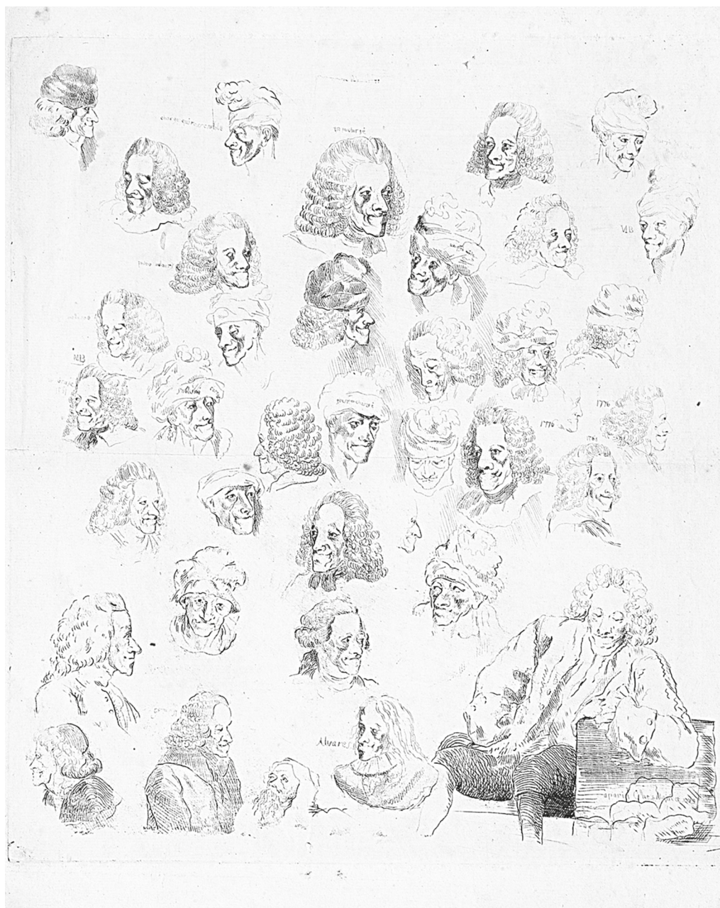
D'après Jean Huber, « Différents airs en 30 têtes de M. de Voltaire sur les tableaux de M. Huber », gravure, coll. part.