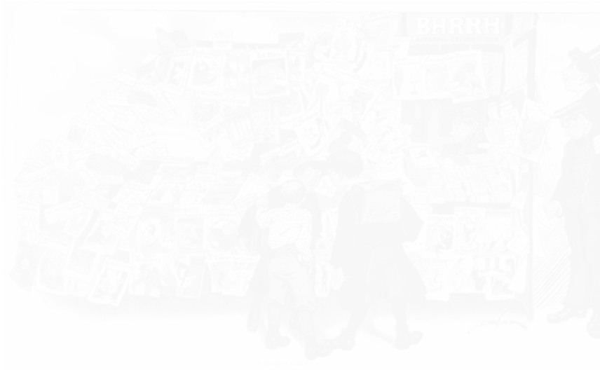
1. Jules Grandjouan, dessin paru dans le numéro spécial « Un peu de Publicité » entièrement réalisé par Grandjouan, Le Rire , 8 e année, n° 406, 16 août 1906, p. 8-9, coll. part. (voir cahier couleur I, pl. Ia)