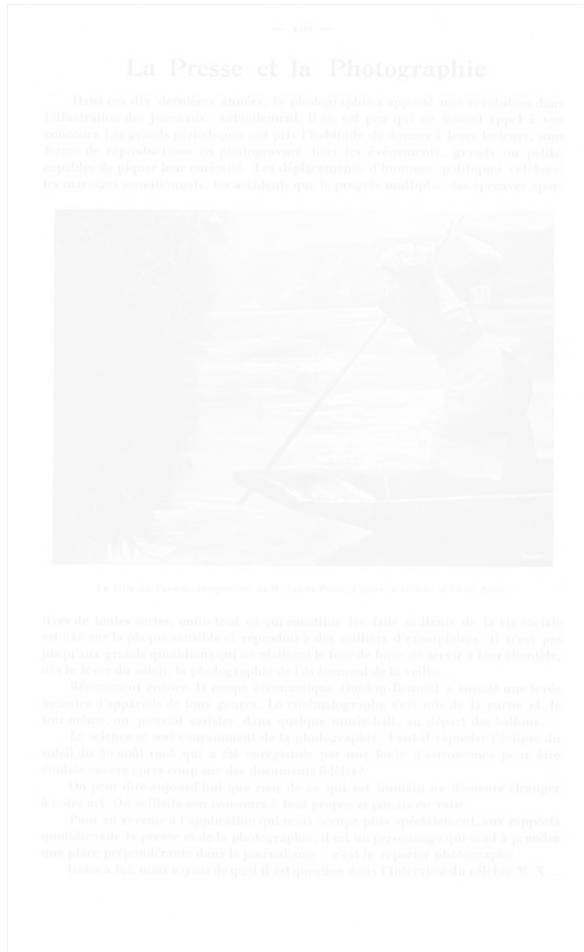
Fig. 16. La Fille du Passeur , composition de M. James Picot, d'après le tableau d'Émile Adam Photo-Magazine (Paris), 1 er semestre 1907, p. 100

La reproduction illustre un article extrait de L'Arc-en-Ciel , signé B. Lihou, sur la pertinence de la photographie d'actualité dans la presse !