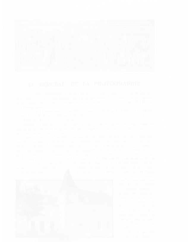
Fig. 9. La Maison de Nicéphore Niépce vue du jardin , Photo-Magazine (Paris) premier semestre 1905, p. 1. Illustration pour « Le Berceau de la photographie » traduit de Photogram , texte et photographie de E. Brown

Cinquièmement, le cadre , la forme et le format . Plus nous nous rapprochons de 1900, plus la publication est luxueuse, plus la forme qui contient l'image prend des libertés avec le rectangle traditionnel, ses limites rigoureuses, ses corniches ou ses marges. Il arrive alors que le sujet excède l'espace qui lui est assigné, déborde sur le blanc de la page et rejoigne ainsi – par un habile dégradé – l'espace de réalité que celle-ci est censée constituer (fig. 9).