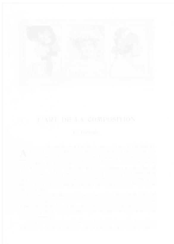
Fig. 17. Trois têtes , par C. Puyo, La Revue de photographie (Paris), n° 4, 1906, p. 1

Accompagne « L'art de la composition. Le portrait », du même : « L'apparition du daguerréotype a démocratisé le portrait » (p. 1). « Néanmoins l'acte de faire représenter sa propre personne a conservé quelque chose de sa gravité ancienne » (p. 2), « [le photographe-portraitiste] aspire à fixer et à rendre sensible quelque chose de l'immatériel que l'enveloppe matérielle opaque du personnage emprisonne » (p. 5).