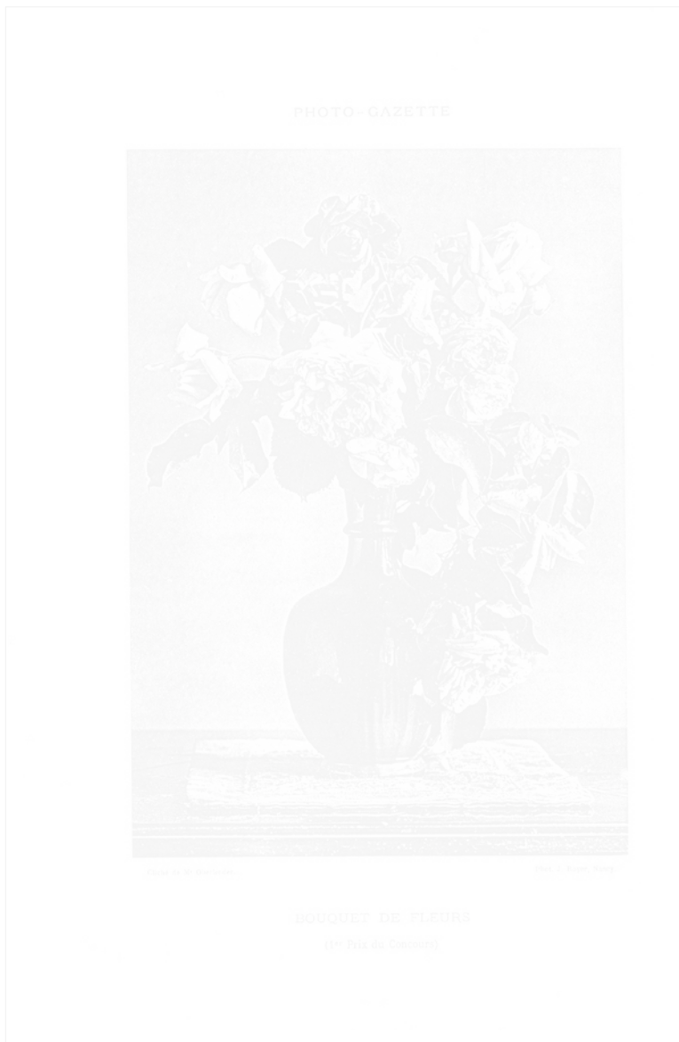
Fig. 11. Bouquet de fleurs , cliché de Mr Oberlender, photo J. Royer, Nancy Photo-Gazette (Paris), 25 novembre 1893, « 1 er Prix du Concours »

Le mérite : les images choisies pour publication sont méritantes ; elles proviennent de photographes célèbres, représentent des personnages notoires, elles ont été primées, ont reçu une médaille au Salon, ont remporté le premier prix de tel ou tel concours (fig. 11).