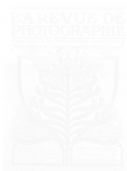
Fig. 18. La Revue de photographie (Paris), n° 1, 15 janvier 1903, couverture