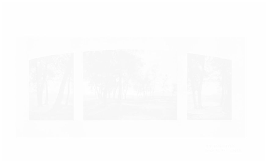
Fig. 20. En Touraine , par H. Foucher, La Revue de photographie (Paris) troisième année, 1906, hors-texte p. 97

Nous concluons ce bref passage en revue par trois remarques. L'illustration pose la question de son artisticité à la photographie, et par là, dans la conjoncture où nous l'avons surprise, à la peinture, art majeur, en général. En second lieu, nous constatons que l'illustration photographique se focalise sur la valeur de vérité des productions artistiques, valeur dont elle prétend être elle-même porteuse, alors qu'en parallèle, et non sans contradiction, elle tend à accéder au statut d'art à part entière en prétendant sacrifier sur cet autel une bonne part de l'« exactitude » et de la fidélité dans la « ressemblance », qui font pourtant son mérite. En troisième lieu, nous prenons acte de ce que la revue de photographie intervient massivement dans ce débat et lui donne une valeur exemplaire. La revue est une tribune. Elle constitue un « lieu de savoir » privilégié. Elle présente l'avantage de mettre à l'épreuve de l'illustration probatoire l'information qu'elle apporte : son autorité est donc beaucoup plus que celle d'un « dire », celle d'un « faire ». Elle prétend fonder sa ligne et juger des produits qu'elle approuve (et publie) dans l'ordre technique (et non plus dans l'ordre philosophique) : il n'y a pas de revue pour faire de la peinture, il y en a pour photographier, une telle occurrence devrait faire réfléchir.