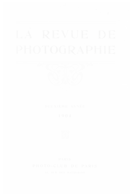
Fig. 19. La Revue de photographie (Paris), deuxième année, 1904, couverture