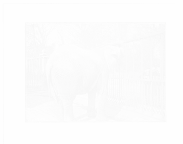
L'Éléphant du Jardin des Plantes, qui tua son gardien récemment, par M. Armand Leclerc.