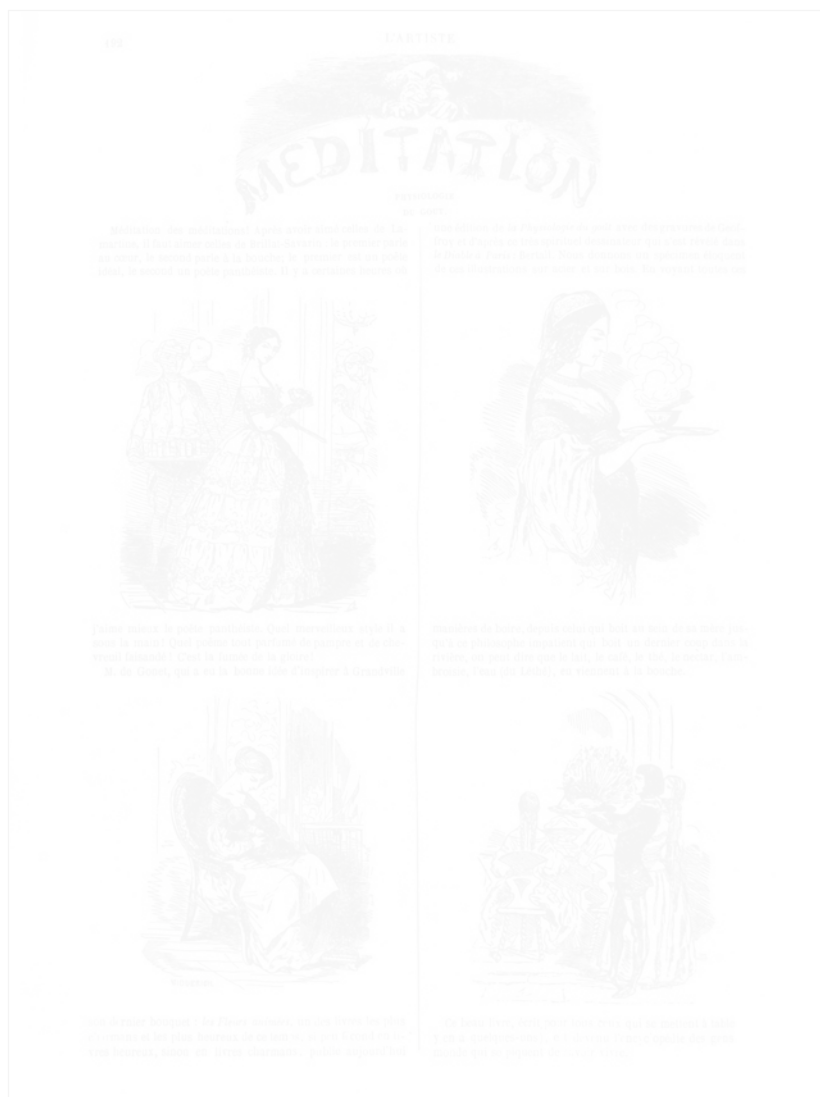
Fig. 40. Geoffroy, Les Boissons , L'Artiste (Paris), 4 e série, t. XI, 23 janvier 1848, p. 192

Morny ou l'impératrice Joséphine), la série des « Modes de saison » entre 1854 et 1856, celle des « Femmes artistes » de Gavarni en 1856-1857, ou encore la série des tableaux du Salon. Le lecteur peut donc se constituer une collection thématique, au fil des numéros. Mais la plupart du temps, les sujets présentés sont en rapport avec le Salon ou l'actualité artistique. Une part importante des illustrations comprend des scènes de paysage et de genre, l'autre partie de la production étant consacrée au portrait. Pour bénéficier d'un maximum de publicité, L'Artiste prend soin d'annoncer ses publications : l'avertissement du 19 mars 1848 indique par exemple aux lecteurs qu'à « partir du prochain