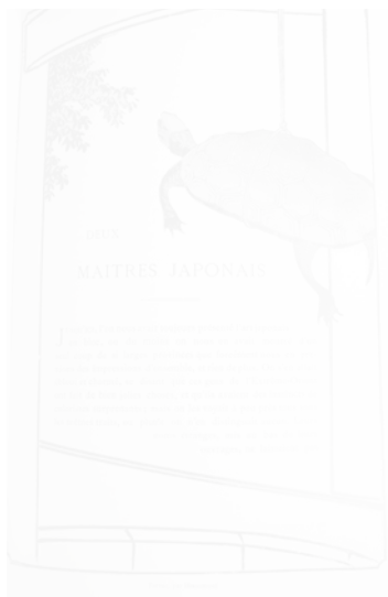
Fig. 42. Anonyme, Tortue par Hiroshige, L'Artiste (Paris), nouvelle période, t. V, février 1893, p. 10