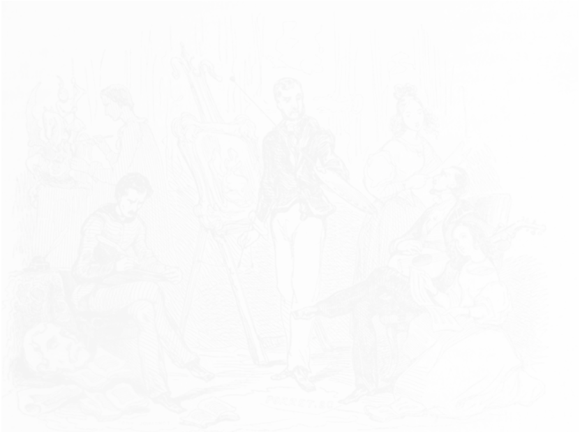
Fig. 39. Tony Johannot, Une soirée d'artistes , L'Artiste (Paris), 1 re série, t. I, 6 février 1831, p. 9

Parmi les grandes revues d'art illustrées du XIX e siècle, L'Artiste représente une source essentielle pour la connaissance de l'histoire de l'art et de l'histoire de la littérature de ce siècle. C'est principalement L'Artiste de la période romantique qui a retenu l'attention des historiens de l'art 1 . La question du rapport texte/ image est à cette époque un sujet central dans la revue. En effet, dès la création