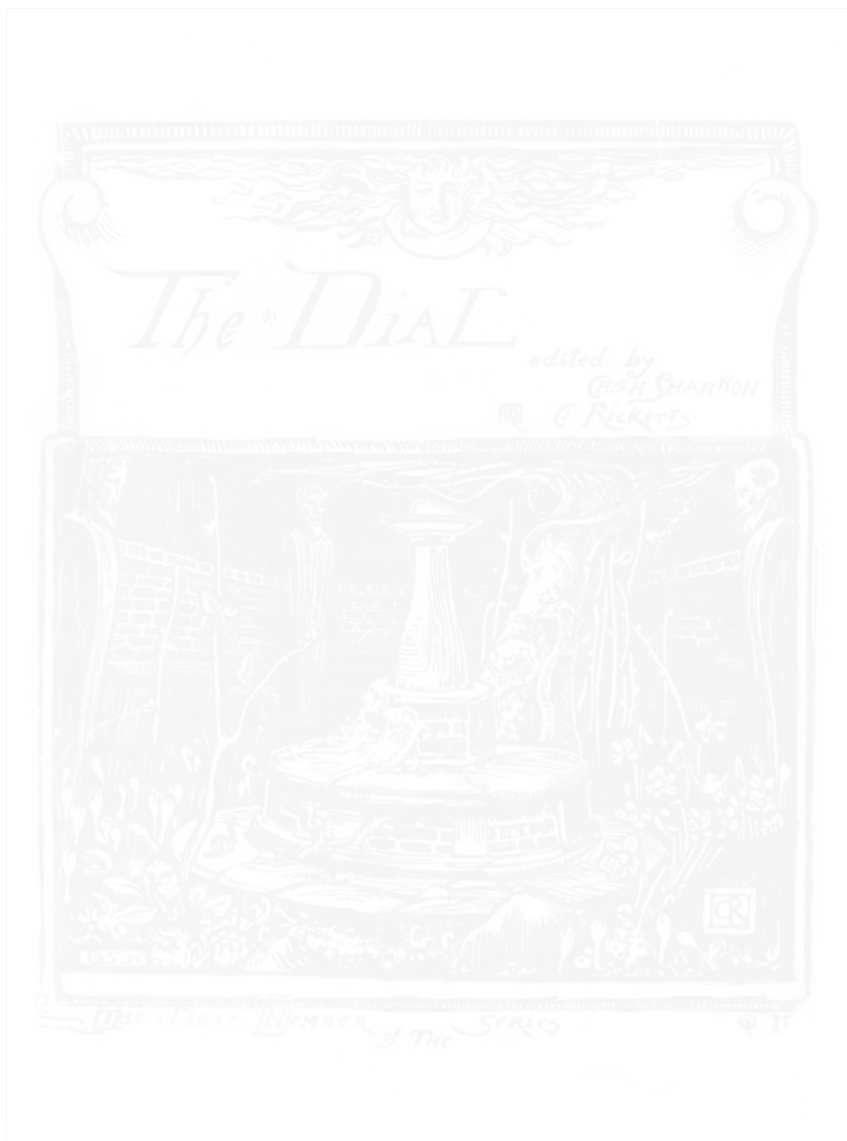
Fig. 134. Charles Ricketts and Charles Shannon, The Dial, An Occasional Publication (Londres), n° 1, 1889, couverture. British Library, C.99.1.2.