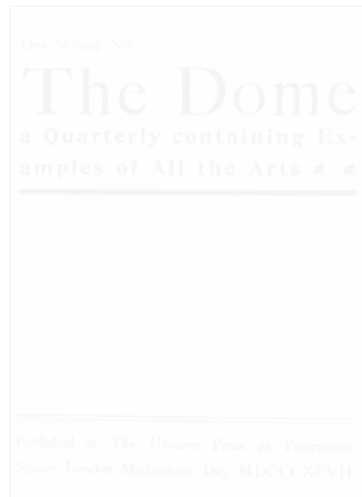
Fig. 135. The Dome: A Quarterly containing Examples of All the Arts (Londres), première série, n° 3, 1897

européens tels que le symbolisme par la culture britannique autochtone 3 . Binyon et Ricketts ont de nombreux points en commun, mais ils divergent aussi dans leur façon de considérer le public. Je me propose donc d'examiner ces deux revues dans leur contraste instructif entre une attitude esthète et des positions plus ouvertes, et dans leurs vues divergentes – et cependant partagées – du problème que posent la marginalisation de l'art et l'indifférence ou l'insensibilité du public.