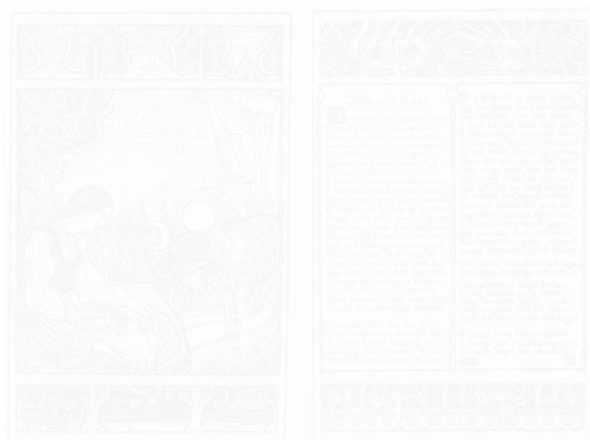
Fig. 188. Aladár Körösfői-Kriesch, La Belle Juliette , Művészet [L'Art] (Budapest) t. II. n° 2, 1903, hors-texte entre les p. 108-109

Le dessin de Sándor Nagy intitulé Le Sceptre et le bâton de mendiant montre une correspondance encore plus étroite entre le dessin et le texte. Le texte est inséré dans l'image, mais s'en détache quand même (fig. 189). Texte et image sont comme deux surfaces planes superposées. Les paroles sont écrites dans trois rectangles horizontaux isolés les uns des autres, soulignés par des cadres contournés. Sándor Nagy n'est pas indifférent aux questions de technique : il pense en effet que la zincographie n'est appropriée qu'aux dessins en noir et blanc, et n'a donc pas utilisé de couleur. Dans une lettre au directeur de la revue, il demande simplement d'ajouter un peu de rouge au noir, pour l'intensifier.