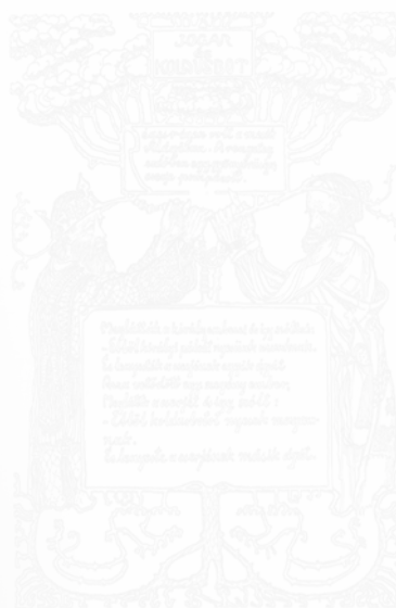
Fig. 189. Sándor Nagy, Le Sceptre et le bâton de mendiant , Művészet [L'Art] (Budapest), t. II, n° 1, 1903, hors-texte entre les p. 72-73

Le dessin de Sándor Nagy intitulé Le Sceptre et le bâton de mendiant montre une correspondance encore plus étroite entre le dessin et le texte. Le texte est inséré dans l'image, mais s'en détache quand même (fig. 189). Texte et image sont comme deux surfaces planes superposées. Les paroles sont écrites dans trois rectangles horizontaux isolés les uns des autres, soulignés par des cadres contournés. Sándor Nagy n'est pas indifférent aux questions de technique : il pense en effet que la zincographie n'est appropriée qu'aux dessins en noir et blanc, et n'a donc pas utilisé de couleur. Dans une lettre au directeur de la revue, il demande simplement d'ajouter un peu de rouge au noir, pour l'intensifier.