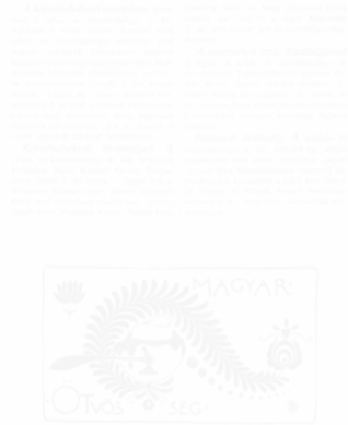
Fig. 191. Fülöp Beck Ö., Cul-de-lampe : Orfèverie hongroise, Magyar Iparművészet [ L'Art décoratif hongrois ] (Budapest), t. I, n° 8, septembre 1898, p. 372