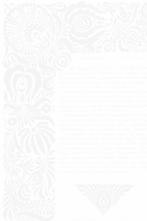
Fig. 190. Károly Kótász, Décoration de page dans Magyar Iparművészet [ L'Art décoratif hongrois ] (Budapest), t. I, n° 9, novembre 1898, p. 386

La revue L'Art décoratif hongrois se concentre plutôt sur le livre comme objet d'art. À l'origine, dans les années 1897-1898, les ornements Art Nouveau, les ornements empruntés à l'art populaire et les motifs nés du mélange de ces deux types envahissent les pages et le corps du texte (fig. 190 et fig. 191). Ils reflètent la conception idéologique des auteurs, qui veulent créer un langage, une ornementation à la fois moderne et nationale, basée sur la richesse des motifs de l'art vernaculaire. On peut deviner ces motifs sur différents objets d'art, des tapisseries, des meubles, des tissus.