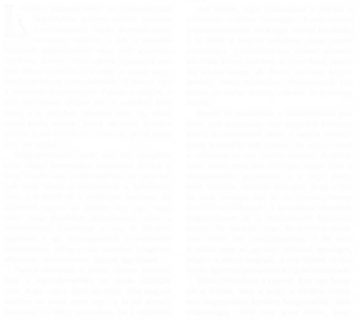
Fig. 187. József Rippl-Rónai, En-tête, Művészet [ L'Art ] (Budapest), t. I, n° 1, 1902, p. 28

toutes sortes (fig. 187). Sur le plan technique, les périodiques utilisent la gravure sur bois et la lithographie, avant de passer à des procédés de reproduction photomécaniques ou chimiques, dont principalement l'autotypie et la zincographie, qui ne sont pas des techniques de reproduction entièrement mécaniques, mais plutôt des procédés d'impression particuliers, élaborés à l'origine pour la reproduction de dessins à la plume et à l'encre de Chine. Ces techniques sont capables de rendre avec une précision croissante la finesse de l'œuvre originale.