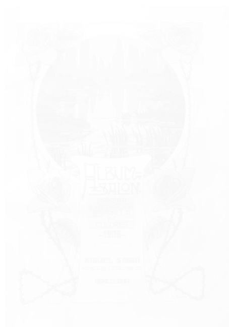
Fig. 222. Gaspar Camps, page de titre du volume de l'année 1906, Álbum Salón (Barcelone), 1906 (voir cahier couleur III, pl. XXIV)