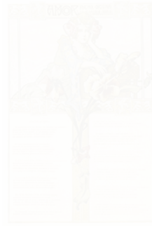
Fig. 214. Gaspar Camps, illustration en couleurs pour le poème « Amor », Álbum Salón (Barcelone), 1902, p. 198 (voir cahier couleur III, pl. XIX)