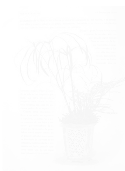
Fig. 220. Page illustrée en couleurs, Hispania (Barcelone), n° 20, 15 décembre 1899, p. 272

ensemble iconique n'ait pas de rapports directs avec le texte, il n'est pas purement décoratif puisqu'il rend en quelque sorte l'atmosphère tragique des poèmes. Outre l'ambiguïté d'une image à la fois décorative et référentielle, mais pas illustrative puisqu'elle ne décrit pas, mais suggère une atmosphère ou un sentiment (ce qui la fait participer de l'esthétique symboliste), il faut souligner l'interpénétration, la fusion de l'espace iconique et de l'espace textuel. Le procédé de surimpression du texte sur l'image atteint parfois des degrés d'imbrication, de confusion formelle, qui rendent difficile sa lecture, comme dans cette page de Hispania , où le texte