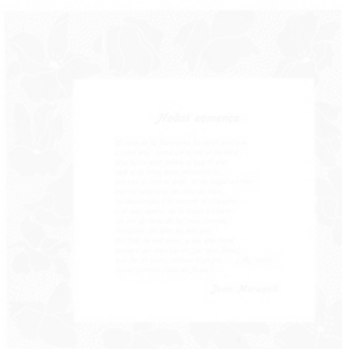
Fig. 208. Adrià Gual, encadrement en couleurs pour le poème de Joan Maragall « Nadal comença » [« Noël commence »], Garba (Barcelone), n° 5, 23 décembre 1905, n.p. (voir cahier couleur III, pl. XXII)

Il s'agit d'une typologie très courante du livre 1900, que l'on trouve dans les livres et les revues britanniques du mouvement Arts & Crafts, en particulier dans les ouvrages de la Kelmscott Press de William Morris – une résurgence du livre gothique, des manuscrits médiévaux. Ce décor périphérique, presque toujours floral, peut être géométrique, coloré, comme dans l'encadrement rectangulaire, légèrement asymétrique du poème de Joan Maragall dans la revue Garba (fig. 208). Il peut aussi être fait de formes florales libres, dans un schéma néanmoins rectangulaire, mais asymétrique, avec un espace textuel encadré par une ligne irrégulière,