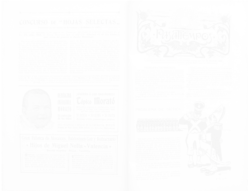
Fig. 202. Double page illustrée, Hojas Selectas (Barcelone), n° 51, mars 1906, n.p.

Bien que datant de 1904, cette mise en page de la double page de la revue Hojas Selectas est assez conventionnelle (fig. 202). Le texte, en deux colonnes, est divisé en deux horizontalement, sur la page de gauche, par la section des annonces commerciales, où se trouve un élément iconographique, un visage de bébé à gauche, équilibré par le texte à droite, alors que sur la page de droite l'en-tête de la rubrique « Pasatiempos » [« Passe-temps »] occupe le haut de la page et qu'une illustration vient équilibrer le texte « Problemas de táctica » [« Problèmes de tactique »] en bas à droite. On note toutefois des éléments formels caractéristiques des revues 1900. D'abord, la décoration florale en arabesque qui entoure la manchette de la rubrique « Pasatiempos » et la typographie elle-même, libre et curviligne. Puis, on constate que l'illustration en bas, sur la page de droite, ne se contente pas de se développer sur le rectangle symétrique à celui du texte, mais qu'elle déborde par le coude du soldat et se prolonge horizontalement par la file des fantassins qui vient s'imbriquer dans l'espace textuel et séparer le titre du texte. Cependant ces détails ne modifient pas fondamentalement la composition, somme toute assez traditionnelle, de cette double page, avec l'équilibre entre le texte et l'image.