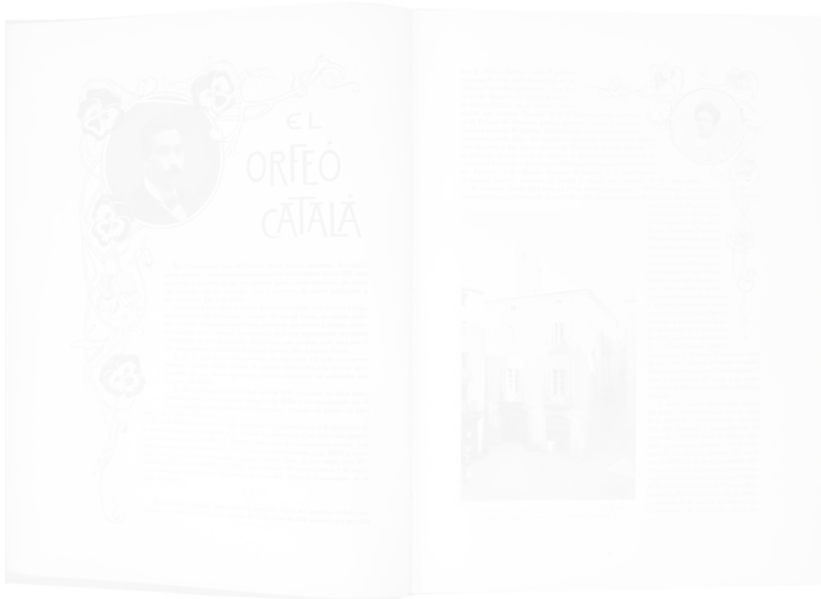
Fig. 205. « El orfeó català » [« L'orphéon catalan »], double page illustrée Hispania (Barcelone), n° 24, 15 février 1900, p. 40-41

on aurait eu un texte littéralement crucifié, mais avec en plus la cinquième vignette centrale, on aboutit à un texte démembré, de lecture peu aisée, dans des colonnes de texte très étroites.