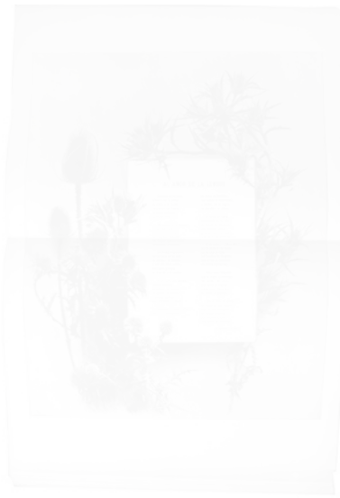
Fig. 211. Double page accueillant le poème « Al amor de la lumbre » [« Au coin du feu »], photographie en noir et blanc, Hispania (Barcelone), n° 25, 28 février 1900, p. 64-65