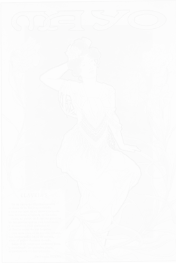
Fig. 199. Eulogio Varela, Mayo , peinture, Blanco y Negro (Madrid), almanach de 1900 (voir cahier couleur III, pl. XVI)