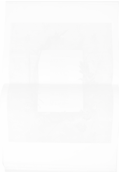
Fig. 210. Double page accueillant le poème « La missatgera més segura » [« La Messagère la plus sûre »], photographie en couleurs, Hispania (Barcelone), n° 6, 15 mai 1899, p. 40-41

comme dans cette page de la revue Hispania (fig. 209). Plus envahissant, il peut occuper la plus grande partie de la surface de la page et déborder sur le rectangle de l'espace textuel central, alors que, du fait de la composition de l'image sur une double page, le texte à l'horizontale oblige le lecteur à tourner de 90° la revue, ici encore Hispania , pour la lire (fig. 210). Il est clair que pour le maquettiste la conception de la double page comme une image a prévalu sur le message textuel. On constate même que le fond de l'espace textuel est coloré, vert turquoise, couleur complémentaire du rouge violet des dahlias et du texte imprimé. Donc l'espace textuel