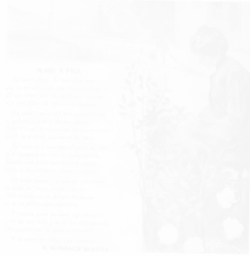
Fig. 219. Lluís Masriera, surimpression de l'image et du texte « Mare y fill » [« Mère et fils »], Garba (Barcelone), n° 1, 18 novembre 1905, n.p. (voir cahier couleur III, pl. XXIII)

ensemble iconique n'ait pas de rapports directs avec le texte, il n'est pas purement décoratif puisqu'il rend en quelque sorte l'atmosphère tragique des poèmes. Outre l'ambiguïté d'une image à la fois décorative et référentielle, mais pas illustrative puisqu'elle ne décrit pas, mais suggère une atmosphère ou un sentiment (ce qui la fait participer de l'esthétique symboliste), il faut souligner l'interpénétration, la fusion de l'espace iconique et de l'espace textuel. Le procédé de surimpression du texte sur l'image atteint parfois des degrés d'imbrication, de confusion formelle, qui rendent difficile sa lecture, comme dans cette page de Hispania , où le texte