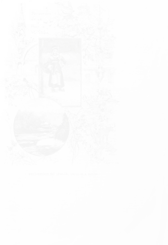
Fig. 193. Alexandre de Riquer, Recuerdos de un viaje en Italia [ Souvenirs d'un voyage en Italie ] dessin à la plume, Arte y Letras (Barcelone), n° 1, 1882

Elles sont fréquentes dans les Ilustraciones , jusqu'en 1890 environ, elles marquent bien la séparation entre le texte et l'image. Même si elles ont un rapport avec le texte situé sur la page opposée, elles acquièrent un statut autonome, indépendant. J'ai choisi un exemple du début des années 1880, tiré de la revue Arte y Letras , parce qu'il montre excellemment la juxtaposition dans une même composition de deux illustrations, deux souvenirs graphiques d'un voyage en Italie, une scène de genre présentant une jeune paysanne italienne insérée dans un cadre rectangulaire, et un paysage de bord de rivière dans un encadrement circulaire, qui fonctionnent comme des zooms photographiques, des gros plans plus sombres et plus denses que le reste de l'image, composé d'une sorte de fond décoratif à la fois architectural et floral, où la faune est même présente, fond sur lequel s'inscrit en lettres manuscrites décoratives, d'un même statut que la flore, le titre Recuerdos de un viaje en Italia (fig. 193).