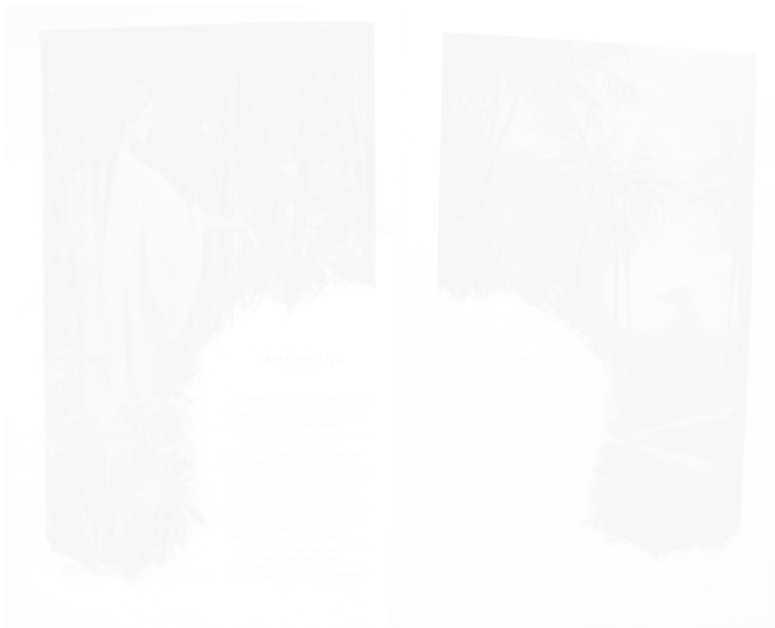
Fig. 196. J. M. Xiró, dessins au crayon pour le poème « Americana » La Ilustración (Barcelone) n° 847, 21 mars 1898, p. 13

Dans les exemples suivants, la tentative d'encadrement périphérique du texte par l'image devient encore plus évidente, parce que l'image n'est plus délimitée par un filet. Elle vient en plus envahir, grignoter l'espace théoriquement rectangulaire, dévolu au texte au centre de la page. Dans cet exemple, tiré de la revue La Ilustración (fig. 196), l'image a un rapport thématique étroit avec le texte puisqu'il s'agit dans les deux cas d'exotisme, mais elle a aussi une fonction décorative évidente. On commence à avoir une sorte de totalité du message, l'iconique et le textuel se répondent, sans encore fusionner. Le fait que la limite entre le texte et l'image n'est plus géométrique, mais irrégulière, comme la végétation