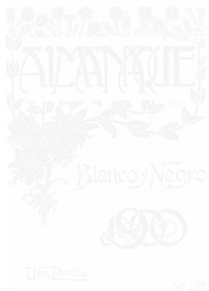
Fig. 221. Eulogio Varela, Couverture, Blanco y Negro (Madrid), almanach de 1900