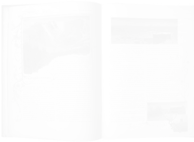
Fig. 206. Jaime Morera, El Guadarrama , double page illustrée Hispania (Barcelone), n° 3, mars 1899, p. 10-11