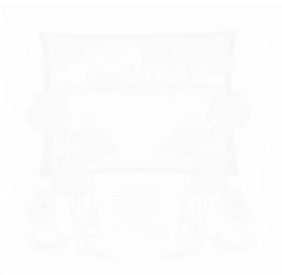
Fig. 215. Illustration en couleurs, Garba (Barcelone), n° 6, 30 décembre 1905, n.p. (voir cahier couleur III, pl. XX)

Dans les exemples précédents, la séparation spatiale entre le texte et l'image était presque respectée, même s'il y avait des empiètements de l'image sur le texte.