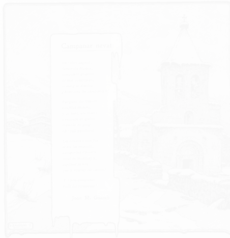
Fig. 201. Dionis Baixeras, dessin à la plume et encadrement pour le poème « Campanar nevat » [« Clocher enneigé »], Garba (Barcelone), n° 4, 16 décembre 1905, n.p.