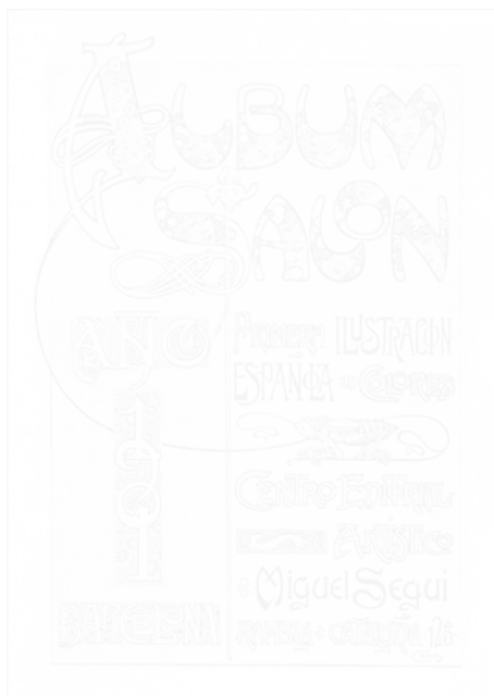
Fig. 223. Gaspar Camps, page de titre du volume de l'année 1901, Álbum Salón (Barcelone), 1901 (voir cahier couleur III, pl. XXV)