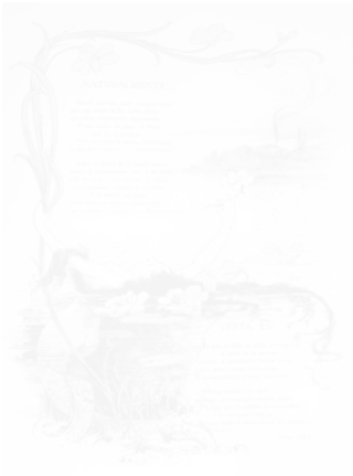
Fig. 218. Surimpression du texte et de l'image, Hispania (Barcelone), n° 13, 30 août 1899, p. 157