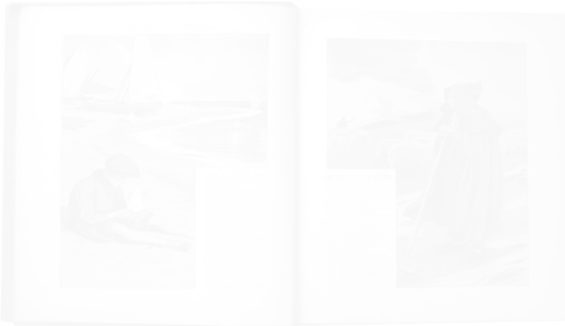
Fig. 195. Dionis Baixeras, Junio, Julio , dessins en couleurs Hispania (Barcelone) almanach pour 1900, p. 8-9