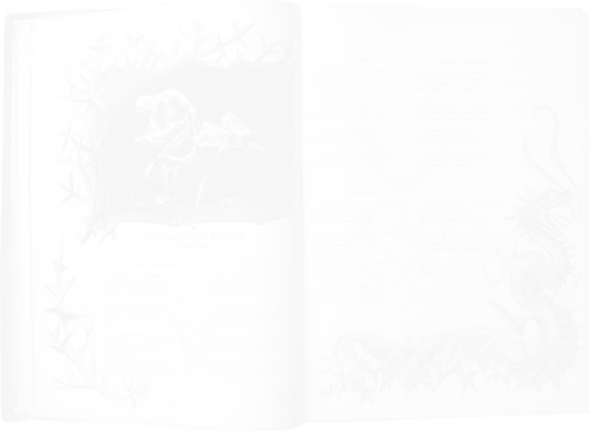
Fig. 217. A. Clapés, J. Pascó, Double page figurée et décorée de la séquence de sonnets « Impresiones del desastre » [« Impressions du désastre »] Hispania (Barcelone), n° 2, février 1899, p. 10-11