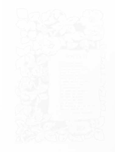
Fig. 209. Joaquín Diéguez, dessin à la plume, encadrement pour le poème « Hoy la vi » [« Je l'ai vue aujourd'hui »], Hispania (Barcelone), n° 47, 20 janvier 1901, p. 31

participe lui-même de la décoration. Dans un autre exemple d'encadrement photographique floral, toujours tiré de Hispania (fig. 211), un phénomène