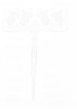
Fig. 213. Josep Triadó, décoration verticale axiale en couleurs pour le poème « Cantares » [« Chants »], Hispania (Barcelone), n° 19, 30 novembre 1899, p. 252 (voir cahier couleur III, pl. XVIII)