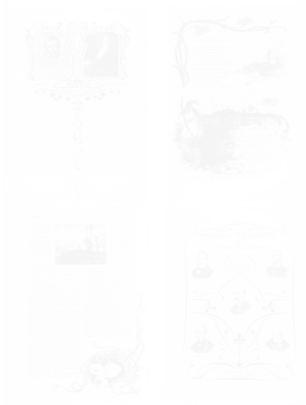
Fig. 207. Quatre pages de la revue Hispania (Barcelone), document tiré de l'ouvrage Las artes gráficas de la época modernista en Barcelona Barcelone, Gremio d'Industrias Gráficas en Barcelona, 1977, p. 12