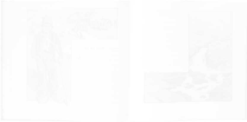
Fig. 194. Dionis Baixeras, dessins au fusain pour le texte « Els dos bailets » [« Les Deux Valets de ferme »], Garba (Barcelone), n° 3, 9 décembre 1905, n.p.