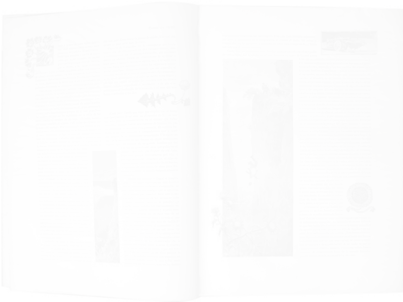
Fig. 203. Double page illustrée, Hispania (Barcelone), n° 1, janvier 1899, p. 6-7

Il n'en va pas de même pour l'exemple suivant, tiré de Hispania (fig. 203). La mise en page n'est plus symétrique, équilibrée, le typographe a adopté