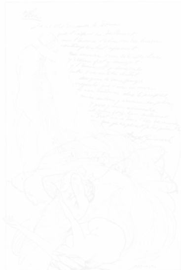
Fig. 198. A. Solé y Plà, dessin à la plume illustrant le texte « Vida » [« Vie »], Joventut (Barcelone), n° 151, 1 er janvier 1903, p. 12