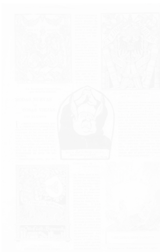
Fig. 204. « Modas nuevas de cosas viejas. Los ex libris », [ « Modes nouvelles de choses anciennes. Les ex-libris »], page illustrée de cinq ex-libris, Pluma y Lápiz (Barcelone), n° 111, janvier 1902, n.p.

l'asymétrie, l'eurythmie pour la composition en diagonale des images par rapport au texte, qui doit s'adapter à l'emplacement arbitraire des images. Il faut noter aussi que, dans ces illustrations pour un conte, trois images sur six ont un rapport avec la diégèse, et trois sont purement décoratives, florales. De plus, sur la vignette la plus grande, qui montre l'instant le plus dramatique, le point culminant du conte, se profile en bas, en gros plan, un élément floral décoratif, externe à la scène. On constate encore une fois cette double valeur illustrative et décorative de l'image. Parfois, la mise en page rend la lecture du texte malaisée, comme dans cette page d'un article sur les ex-libris (fig. 204), tirée de la revue Pluma y Lápiz , où, déjà avec les quatre vignettes aux quatre coins de la page,