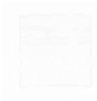
Fig. 216. Dionis Baixeras, dessin en couleurs pour le poème « Desitg de llum » [« Désir de lumière »], Garba (Barcelone), n° 10, 27 janvier 1906, n.p. (voir cahier couleur III, pl. XXI)