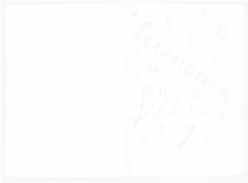
Fig. 249. Nikolai Koulbine, sans titre, Vzorval (Saint-Petersbourg), 1913, 2 e éd., p. 4

C'est ainsi que dans Vzorval , on observe une autonomisation de la lettre, tendant à s'abstraire de sa fonction signifiante pour devenir pur signe plastique 43 . Ainsi, à la page 4 du recueil, des lettres semblent s'échapper d'un mot zaoum, mimant de la sorte leur fuite du régime signifiant (fig. 249). Leur éparpillement dans l'espace empêche un sens de lecture unifié, ce qui valorise ces lettres comme de purs signes plastiques, tandis que certains signes, méconnaissables en tant que lettres, ressemblent à des oiseaux en plein vol, illustrant le stade à atteindre de la lettre autonome. Ces signes inconnus évoquent des caractères hébreux, ce qui n'est pas fortuit. Les caractères hébreux, généralement illisibles pour un Russe, devant être lus de droite à gauche, ne peuvent se présenter que comme signes privés de référent et s'offrir par conséquent dans toute leur dimension plastique. C'est pourquoi l'hébreu apparaît aux futuristes comme