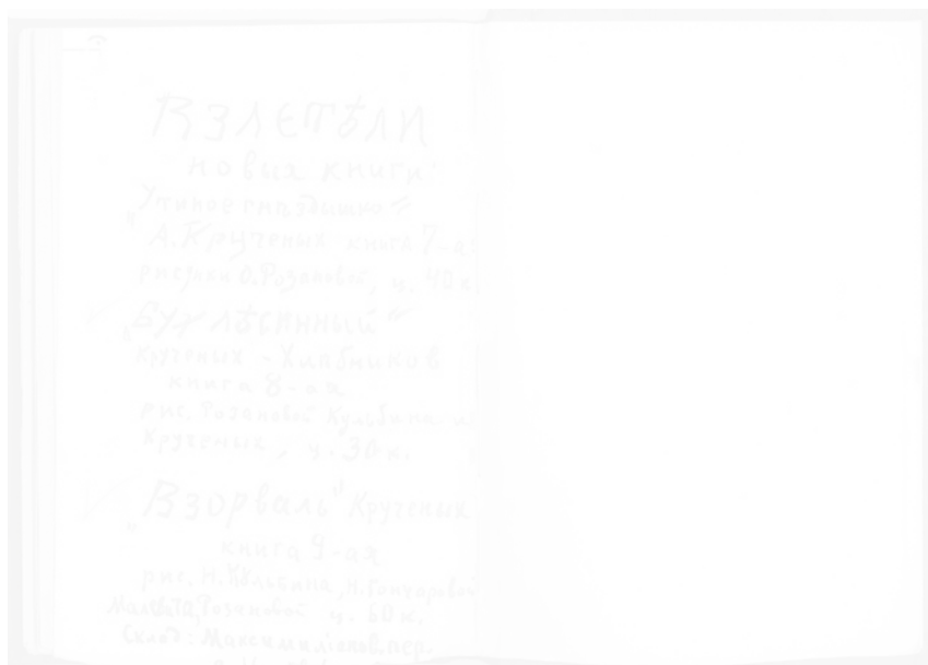
Fig. 243. Olga Rozanova, annonce de parution, Le Nid de canards des vilains mots (Saint-Petersbourg), 1913, p. 23