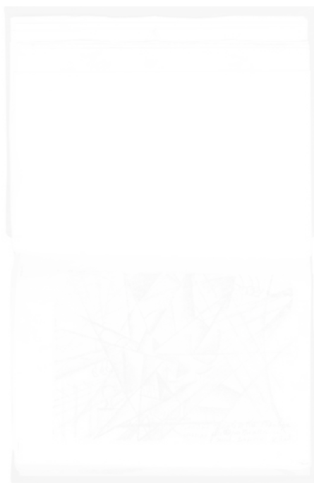
Fig. 244. Kazimir Malevich, Mort simultanée d'un homme en avion et en chemin de fer (Saint-Petersbourg), 1913, 2 e éd., p. 17