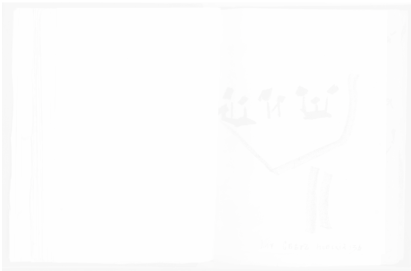
Fig. 250. Nathan Altman, Chich, Vzorval (Saint-Petersbourg), 1913, 2 e éd., p. 29