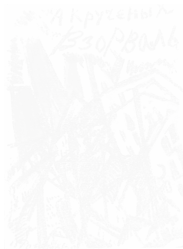
Fig. 253b. Olga Rozanova, couverture de Vzorval (Saint-Petersbourg), décembre 1913, 2 e éd.