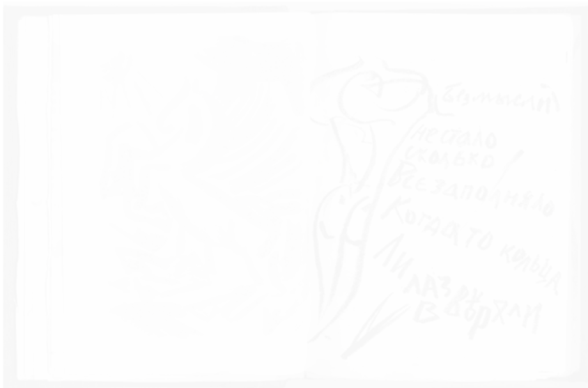
Fig. 254. Nikolai Koulbine, texte d'Alekseï Kroutchonykh Vzorval (Saint-Petersbourg), 1913, 2 e éd., p. 15

Pour la deuxième occurrence du mot vzorval , à la page 9, cette fois ce n'est pas la graphie qui rend compte de l'idée d'explosion, mais les dessins éclatés alentour, ainsi que l'implosion de la grammaire et du sens dans le poème. Enfin, la troisième occurrence, à la page 15, se caractérise quant à elle par une graphie très saccadée (fig. 254). Le mot Vzorval (le dernier mot du texte) explose et fait exploser les lettres autour de lui de sorte que pour le lire, l'œil doit effectuer des zigzags comparables à ceux de la couverture du futur Tango s korovami [ Tango des Vaches ] 58 . Le mot, dans sa structure et dans son fonctionnement, se désintègre pour laisser place à un nouveau système de lecture, où une lettre peut renvoyer à plusieurs lettres en même temps.