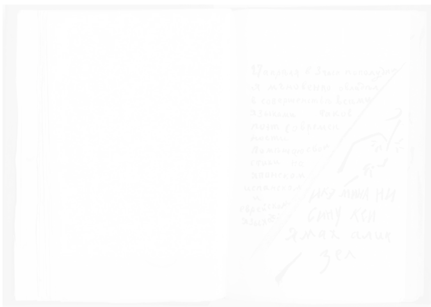
Fig. 248. Nikolai Koulbine, texte d’Alekseï Kroutchonykh Vzorval (Saint-Petersbourg), 1913, 2 e éd., p. 27

C’est la raison pour laquelle les futuristes recourent à l’autolithographie 37 , à l’hectographie et aux tampons encresurs manuels. Il s’agit de redonner aux lettres de la vie, de l’expressivité, de sorte qu’elles transmettent au lecteur une émotion 38 . La page 27 du recueil en fournit une belle application. Construite comme une carte à jouer, elle se partage en deux parties séparées par une diagonale, la première comportant un texte soigneusement calligraphié, la deuxième un texte à la graphie désordonnée et expressive (fig. 248). La première partie comporte une déclaration datée du 27 avril, où Kroutchonykh explique avoir été investi instantanément de la maîtrise parfaite de toutes les langues