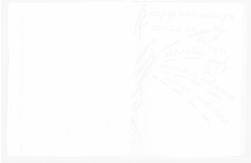
Fig. 251. Nikolai Koulbine, poème d'Aleksei Kroutchonykh Vzorval (Saint-Petersbourg), 1913, 2 e éd., p. 25

se réduisent parfois même à de simples lettres et syllabes comme à la page 25 (fig. 251), de sorte que toute charge sémantique est évacuée au profit exclusif de la dimension graphique 54 .