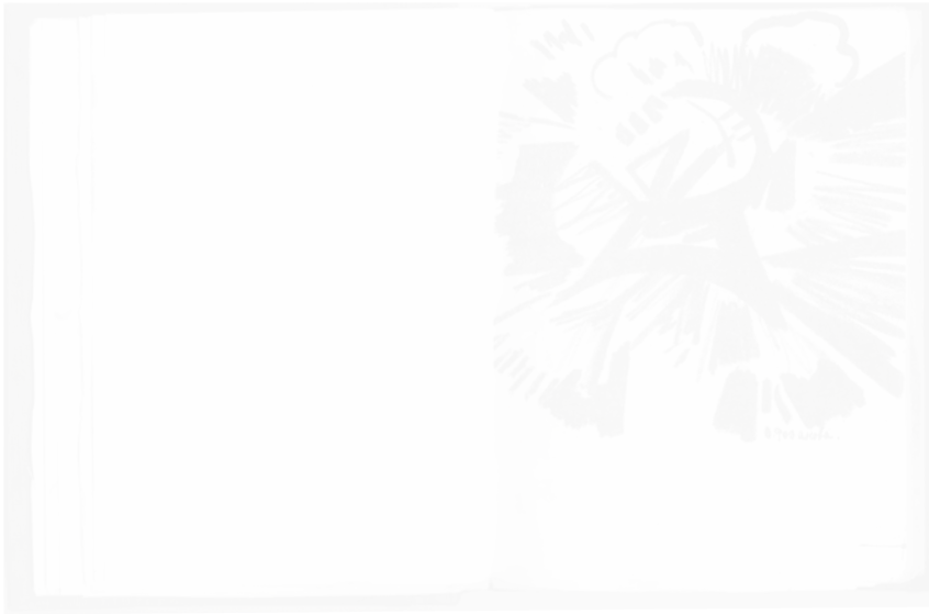
Fig. 255. Olga Rozanova, Explosion, Vzorval (Saint-Petersbourg), 1913, 2 e éd., p. 10

Entre ces explosions verbales, l'image n'est pas épargnée. Dès le portrait de Kroutchonykh par Koulbine, la représentation est minée par des lignes jaillissant du menton du modèle et évoquant une explosion (voir fig. 247). À la page 9, des lignes évoquent des jaillissements lumineux et sonores qui aboutissent, à la page suivante, à une représentation cubo-futuriste d'explosion (fig. 255). Enfin, la lithographie de Malevitch Mort simultanée d'un homme en avion et en chemin de fer représente elle aussi une explosion, celle de l'avion dans lequel meurt l'aviateur, mais également celle des procédés de représentation conventionnels 59 (voir fig. 244).