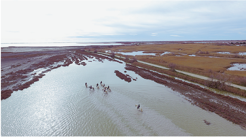
1. Paysage typique de la Camargue vu de drone, le 31 janvier 2016

une culture chère à Jean-Robert Pitte, la vigne. Alors que la crise du phylloxera dévaste la France, inonder les pieds d'une vigne plantée dans du sable permet de la sauver.