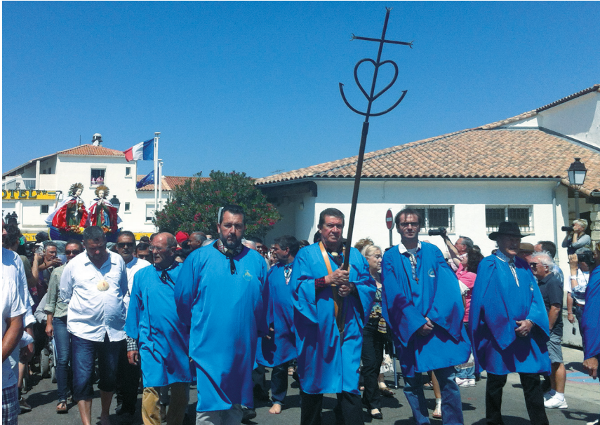
6. Cérémonies du pèlerinage en hommage à Marie-Jacobé et Marie-Salomé (que l'on aperçoit à l'arrière-plan) avec la confrérie des Saintes-Maries-de-la-Mer, 25 mai 2015