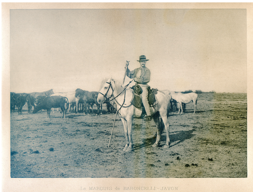
4. Folco de Baroncelli

braconniers et des ouvriers agricoles rongés de paludisme. Sur les illustrations les plus anciennes, le cheval camargue est une pauvre haridelle hirsute, à la tête trop grosse et au ventre gonflé de malnutrition, qui sert à dépiquer les blés. La modernisation agraire aurait dû avoir raison de lui, comme ont disparu maintes races régionales, jugées peu productives. Les bouviers déclassés de Camargue étaient ainsi condamnés à être balayés par le vent de la modernisation agricole et industrielle.