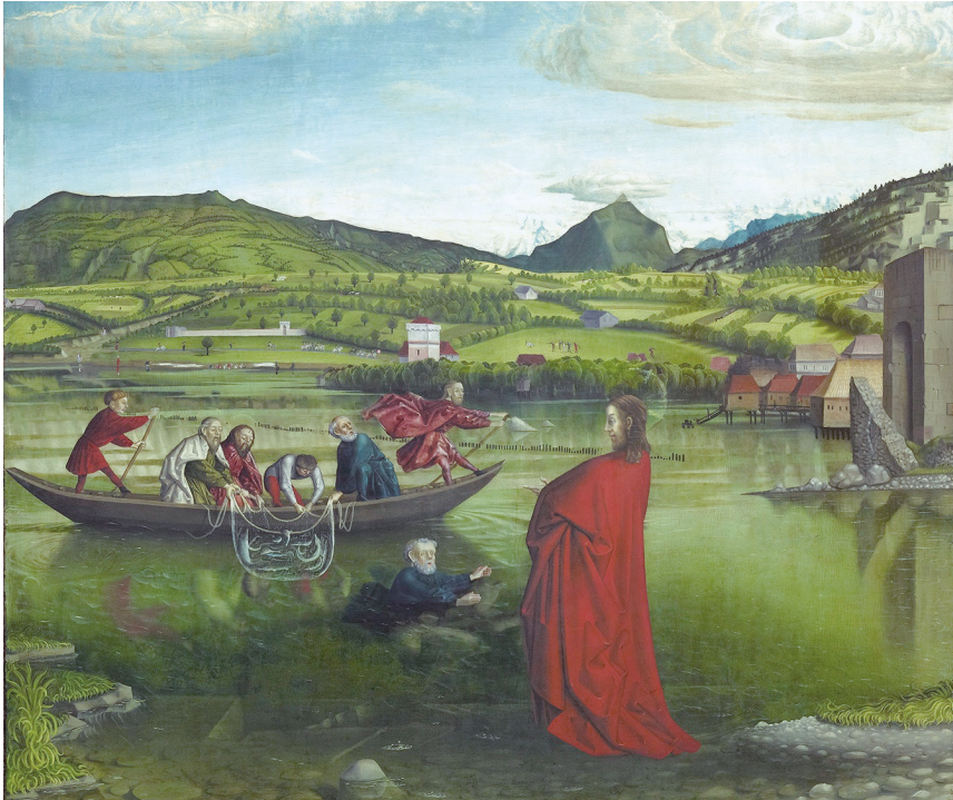
2. La Pêche miraculeuse (retable de Saint-Pierre), Konrad Witz, 1444, huile sur bois de sapin, L : 134,6 cm, h : 153,2 cm, musée d'Art et d'Histoire, Genève

Alors qu'elles semblent inconnues des toiles de l'âge classique, les carrières réapparaissent quand à la fin du XVIII e siècle se développe à nouveau une peinture paysagiste fondée sur l'observation in situ et un intérêt pour le paysage ordinaire. Si l'Oreille de Denys, à Syracuse, peut n'avoir inspiré plusieurs dessins que pour des motifs archéologiques, les Carrières dans la forêt de Fontainebleau que Théodore Caruelle d'Aligny peint vers 1830 puis les très nombreuses toiles, gouaches ou esquisses représentant des sablières, des carrières au cours des décennies suivantes – ne citons que Sand Pits de John Linnell (1849) ou la Carrière de Nanterre de René Billotte (fin du XIX e siècle) – n'ont eu comme sujet que le site d'extraction et ses proches alentours. La récurrence du thème interdit de le tenir pour anecdotique et lorsque Cézanne, entre 1895 et 1902, peint cinq toiles directement inspirées du site des carrières de Bibémus où l'extraction a cessé quelques années plus tôt, un seuil esthétique est franchi. Le jeu de la lumière, les silhouettes végétales se détachant près des anciens fronts de taille dans des bancs très colorés en font un site d'expérimentation picturale et certains historiens de l'art estiment que ces cinq tableaux sont à l'origine du mouvement cubiste. On n'a pas manqué de noter, en effet, la convergence de formes, de couleurs et de lignes du Viaduc à l'Estaque de Braque avec les toiles du maître de la Sainte-Victoire.