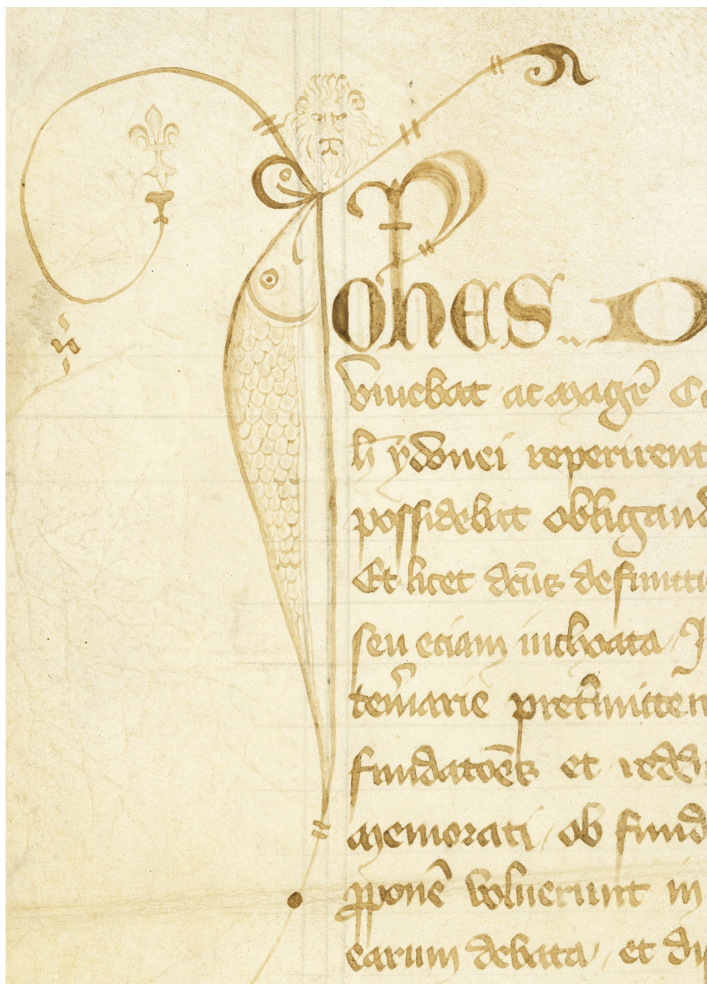
Fig. 2. Jean II le Bon règle la succession de Jean Mignon, maître de la Chambre des comptes (juillet 1353). Arch. nat., J 152 B, n° 22