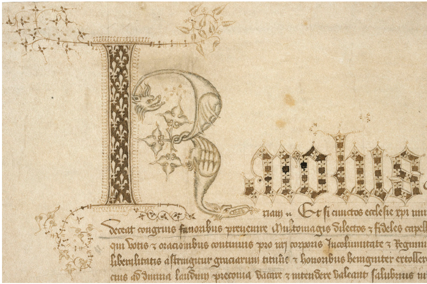
Fig. 7. Charles V institue le port d'aumusses grises fourrées de menu vair pour les chanoines de la Sainte-Chapelle de Paris (janvier 1372). Arch. nat., K 49 B, n° 57

la présence de techniciens de l'écriture et d'artistes bien rodés à cette pratique de la charte ornée, ont donc joué un rôle certain dans les premières imitations. Philippe VI lui-même s'inspirera peut-être de ce modèle en 1343 pour une belle initiale au lis et à la couronne où le lis part en oblique vers la marge supérieure, précédant la lettre au lieu de la suivre 33 . Un autre prince célèbre, Jean de Berry, s'inspira directement de l'iconographie de son père, Jean II le Bon. Dès son retour d'Angleterre, quelques mois après le décès de Jean II, il use d'une initiale J au poisson, avant de prendre comme norme un J à la demi-fleur de lis, tous motifs forgés par le roi Jean 34 . De manière plus spectaculaire encore, les comptables des ducs d'Alençon reprennent à la fin du XIV e siècle un motif aux deux dragons qui est une invention des artistes de Charles V, sans cesse améliorée entre 1364 et 1380. L'un des dessins les plus aboutis figure sur un acte de 1372 (fig. 7), où l'on distingue bien un dragon aquilin, portant un plumage et reconnaissable à son bec, d'un dragon léonin, aux ailes articulées. Repris en un tracé plus simpliste dans le compte alençonnais des années 1390 (fig. 8), les dragons portent tous un plumage, mais on les différencie encore à leur gueule et à leurs oreilles, longues pour le dragon-oiseau et courtes pour le dragon-lion 35 .