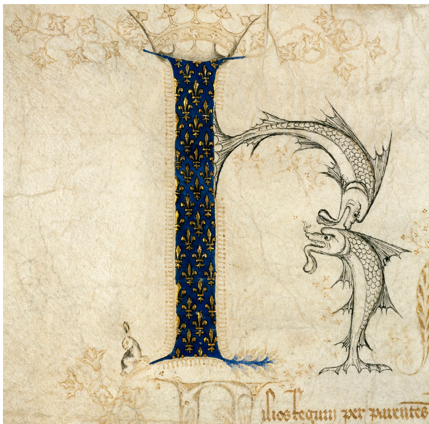
Fig. 3. Ordonnance de Charles V fixant la majorité des rois à quatorze ans (août 1374). Arch. nat., J 401 A, n° 6b

de confirmation des privilèges de la ville d'Agen, en 1443, il fait représenter la scène de remise de sa charte aux gens d'Agen dans une belle enluminure qui remplit son initiale K ; et en 1455, au moment même où il commémore le départ des Anglais du territoire français, un cerf volant portant la bannière de France magnifie une charte qui rappelle l'épopée « du roi de Bourges » 13 .