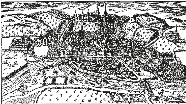
2. La cité de Joinville d'après la Cosmographie de Belleforest (1575)

Portrait ou Plan de la Ville de Joinville.