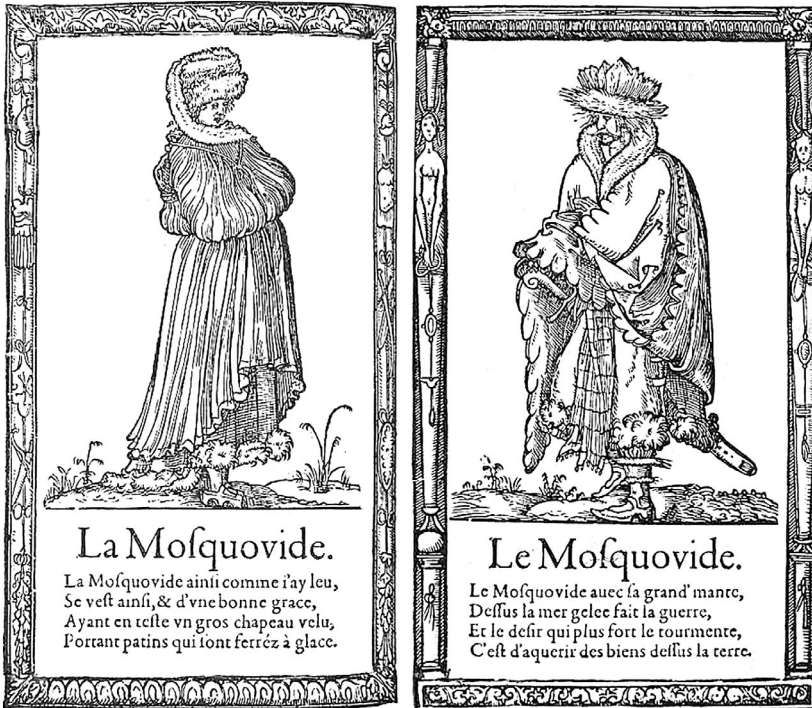
Ill. 18. « La Moscovite » et « Le Moscovite », dans F. Deserps, Recueil de la diversité des habitz , 1567

Epitaphes, epigrams, songs and sonets, 1567.