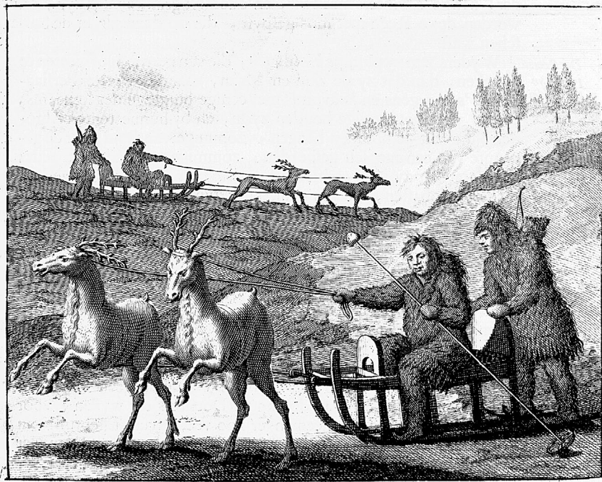
Ill. 19. « Traîneaux des Samoyèdes », dans Ides, Driejaarige reize naar China [...] , 1704