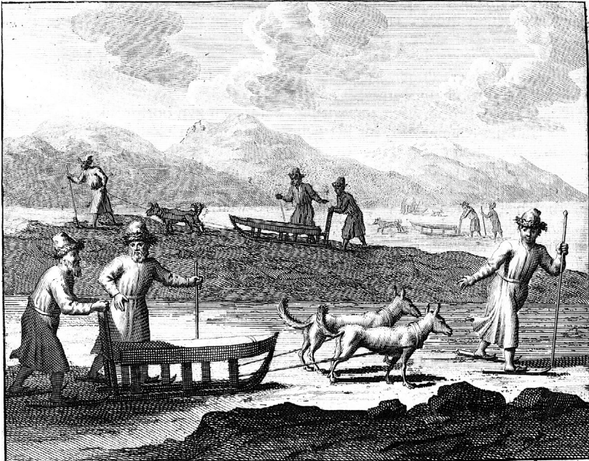
Dus Reijzen de Russchen met honde sleen in sibirien

Ill. 35. « Attelage de traîneaux en Sibérie », dans E.Y. Ides, Driejaarige reize [...] , 1704