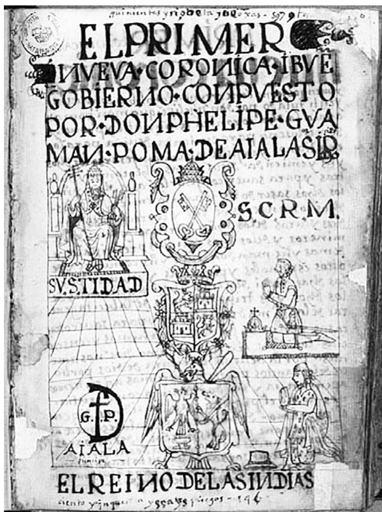
Fig. 2. Frontispice du manuscrit de Felipe Guaman Poma de Ayala, El primer nueva corónica i buen gobierno (v. 1615)