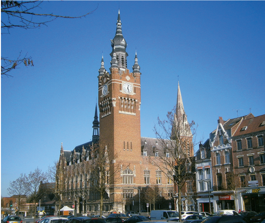
3. The reconstructed town hall of Armentières

[with] brick skeletons staring at you through black and empty eye sockets 25 ". In addition to drawing up a master plan for rebuilding the town, which involved the controversial remodelling of the town square and surrounding streets, Cordonnier designed an impressive town hall in "Flemish Renaissance" style, with a 67-metre belfry (fig. 3). He was responsible for reconstructing the church of Saint-Vaast (evangelist of Flanders) and its 81-metre bell tower, together with the market hall on the main square. He also designed the monument aux morts that was sculpted by Edgar Boutry (1857-1938), and dedicated to the 1085 citizens of Armentières who were killed during the hostilities. In September 1921, a revised version of Cordonnier's master plan was accepted and a team of architects working with him drafted designs for replacing ruined shops, schools, factories and private houses across the town. All worked together "to make the town more attractive than before", with Mayor Charles Conem (1861-1950) having insisted in 1919, that "in five years it will start to take shape, and in ten years it will be finished 26 ". His prediction of the time needed