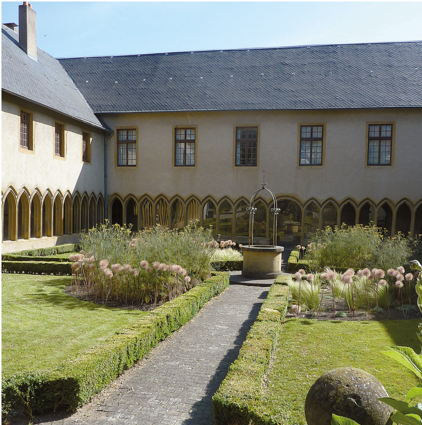
1. Le jardin monastique organisé en quatre carrés bordés par des dentelles de buis taillés, avec le puits central, le cloître [ici : cloître des Récollet à Metz, actuel Institut d'écologie], 2014

la ville d'Ancien Régime, les jardins monastiques conservèrent longtemps des espaces de respiration à la ville. Ainsi, en 1611, Claude de La Ruelle dessine un plan à vol d'oiseau de Nancy. Il est aisé d'y opposer le lacis très serré de la ville ancienne où les jardins sont relégués sur les récents bastions à l'italienne et la Ville Neuve dessinée géométriquement, largement investie par des monastères et fondations pieuses ; la capitale ducale étant un fer de lance de la Contre-réforme 36 . À la Révolution, la vente par lots de tous ces biens a partout accéléré la densification des cœurs de ville. À l'aube du xx e siècle, alors que la France comptait encore presque autant de presbytères que de communes, les jardins de curé représentaient un potentiel de biodiversité exceptionnel.