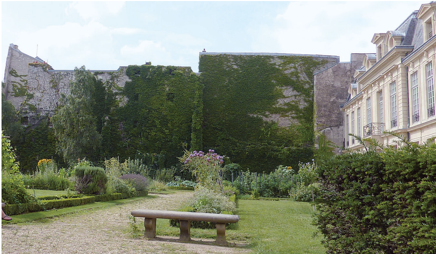
2. Le potager-pelouse fleurie du musée Picasso, Paris, III e arrondissement, 2014 Pendant la longue période de travaux destinée à moderniser le musée, les jardins ont été investis par des plantes potagères et des fleurs rustiques : chardons, soleils, tomates, etc. Semblable démarche a été retenue pour égayer les parterres du musée Carnavalet.

Les potagers sont des témoins de leur temps. Ils ont évolué, varié dans leurs configurations. Ils offrent de nouveaux paysages, répondent à des finalités qui changent (fig. 2). Ils ne sont pas figés et n'adhèrent pas à une approche vieillotte, passéiste, distanciée de nos préoccupations. Le principe de mixité associé à loi SRU et ses ajouts successifs ou les textes du Grenelle de l'environnement évoquant la prise en compte des Trames vertes et bleues (TVB) amènent à aborder autrement les potagers. Il s'agit d'apprécier leurs formes d'insertions dans les interstices de la ville, les banlieues, la dilatation des agglomérations 37 . Le jardin n'est plus seulement rural ou ouvrier, il est pleinement inscrit dans les questions portées par le développement durable dans la ville, sur ses marges et dans les éco quartiers. Il est une composante de la respiration du tissu urbain. Les potagers sont indissociables de nos façons d'habiter, d'être à la recherche d'aménité, de se positionner dans la construction de relations avec les autres. Au moins trois entrées peuvent être visitées pour mesurer ces changements : l'actuelle diversité de notre population, l'envie de partager comme réponse à l'individualisme, enfin le jardin utilisé comme levier ou comme outil pour la réinsertion.