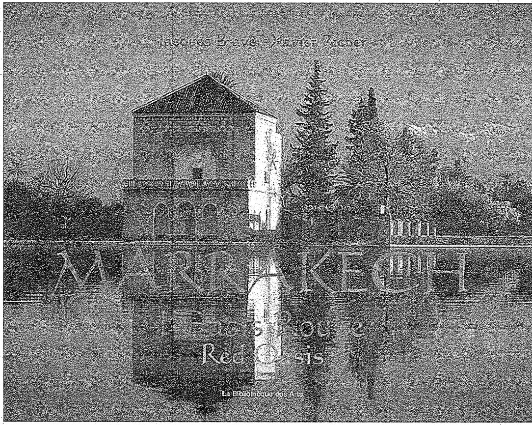
Vol 5: Futur

100 000 ans de beauté est un ouvrage de référence, en 5 volumes, sur la « beauté humaine », publié aux Éditions Gallimard ( www.gallimard.fr ). Cette extraordinaire collection traite de la recherche humaine de beauté à travers les âges et les civilisations. Plus de 300 auteurs, issus de diverses cultures, espaces linguistiques et d'environ 35 nationalités, ont collaboré à ce grand projet. La richesse et la variété de l'iconographie choisie pour illustrer chaque thème sont remarquables: documents d'archives, sculptures, peintures, photographies, images de films... Chaque volume porte sur une grande période historique et a été dirigé par un spécialiste de la période: Vol 1: Préhistoire. Vol 2: Antiquité Vol 3: Âge classique Vol 4: Modernité