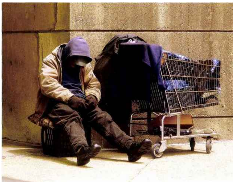
Un sans-abri, vétéran de l'armée américaine, dans les rues de Boston. Si la société américaine ne prend pas soin de ceux qui se sont battus pour elle, que reste-t-il de la « promesse » qu'elle prétend porter ?

éloquement dans Le Prix de l'inégalité : « La puissance mondiale de l'Amérique, c'est son soft power, le pouvoir de ses idées, un système pédagogique qui éduque les dirigeants du monde entier, le modèle qu'elle propose aux autres. [...] Les États-Unis ont longtemps exercé leur influence à travers la vigueur de leur économie et l'attrait de leur démocratie. Mais le modèle américain perd une partie de son lustre. Pas seulement parce que le capitalisme américain n'a pas apporté la croissance prolongée. C'est plutôt que les autres commencent à comprendre que la grande majorité des citoyens d'a pas bénéficié de cette croissance; un modèle de ce genre n'est pas politiquement très attrayant. Et ils sentent bien, aussi, la corruption (à l'américaine) de notre système politique, que pénètre de toute part l'influence d'intérêts privés (14) . »